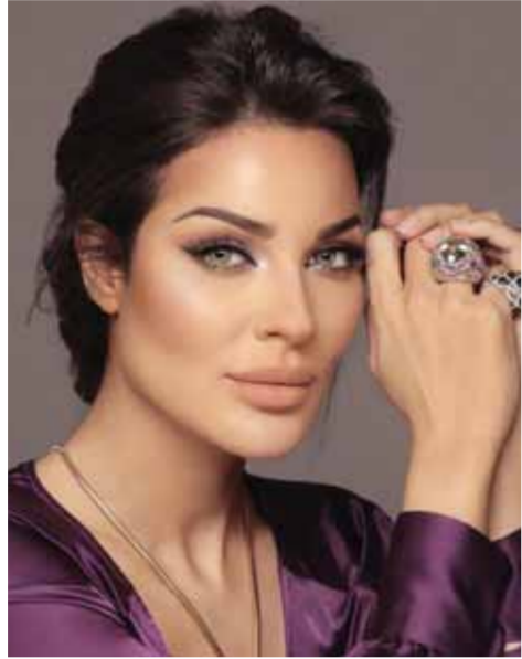
نادين نسيب نجيم

الجميع بعد أن تحدثت عن طبيعة علاقتها بجدتها، وصرحت بأنه لا يوجد اتصال نهائي بينها وبين جدتها منذ ذهابها لإكسترا للدراسة هناك، وحتى بعد وفاة جدتها الفنان الكبير. وأكدت أن والدها، لم يحاول التواصل معها ولو مرة واحدة، حتى بعد تسديده مبلغ قيمته ربع مليون جنيه نفقة لها، بعدما أقامت طليقته منذ الحناوي دعوى ضده مطالبة بمصاريف ابنتهما. وأضافت، أنه لو لزم الأمر وعادت إلى وطنها مصر مرة أخرى، وتصلحت مع والدها، فلن تقبل بالعيش مع زوجته المهندسة ندى الكامل، لأنها تحب والدتها جداً وتقدر تعيها من أجلها. وعبرت عن حزنها الشديد لفقدان جدتها الفنان الكبير فاروق الفيشاوي، الذي كان مقرباً منها ودائم التواصل معها، ولكن وافته الغنية قبل أن تراه للمرة الأخيرة.