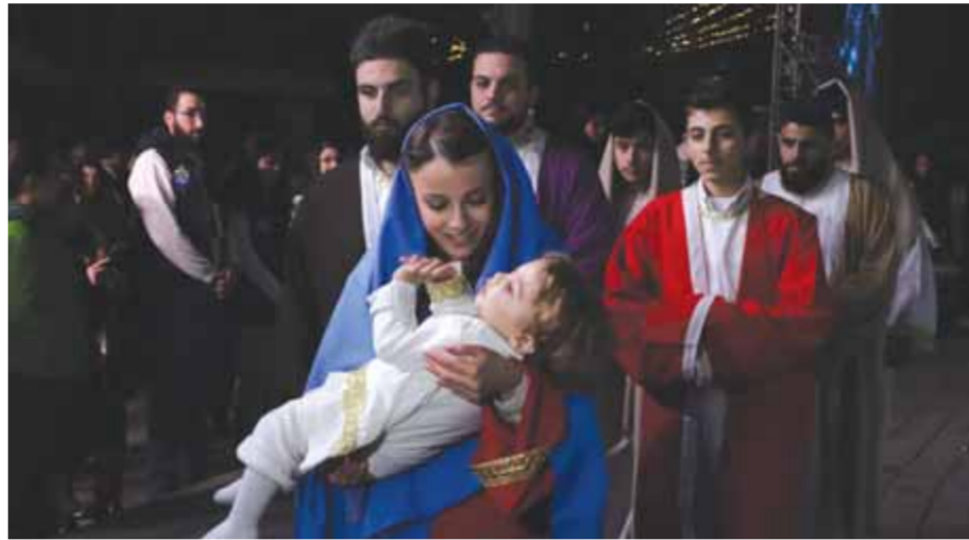
شخصيات المغارة الحية