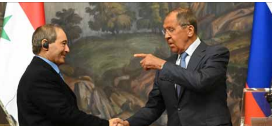
من لقاء سابق بين وزير خارجي سورية وروسيا في موسكو

الادنى من موارد الطاقة اللازمة للحصول على خدماتهم الأساسية. وجدد المقاد التعبير عن إدانة سورية للحملة الغربية التي تستهدف روسيا الاتحادية، وكذلك محاولات تقويض أمنها القومي، مشيراً إلى أهمية الدور الروسي على الساحة الدولية لمواجهة مشاريع الهيمنة الغربية وصولاً إلى إنشاء نظام دولي متعدد الأقطاب يحقق مصالح شعوب العالم وأمنها. وأدان المقاد سياسات الولايات المتحدة وحلفائها لإطالة أمده الحرب في أوكرانيا خدمة لمصالحها الضيقة، بدوره جدد لافروف موقف بلاده الداعم لسيادة سورية واستقلالها ووحدة أراضيها، ودعمها لجهود سورية فيما يتعلق بعودة اللاجئين، مؤكداً أهمية الجهود المبذولة للتحضير لاجتماعات اللجنة المشتركة السورية- الروسية لبحث القضايا الاقتصادية المشتركة وتطوير العلاقات الثنائية. وأكد لافروف إصرار روسيا على الاستقرار بجهودها لحماية سكان دونباس، معبراً عن تقدير روسيا لموقف سورية الداعم لها في مواجهة هذه التحديات، وتبادل الوزيران التهانى بأعياد الميلاد المجيد وبالعلم الجديد، متمنين لشعبي البلدين الأزدهار والسلام.