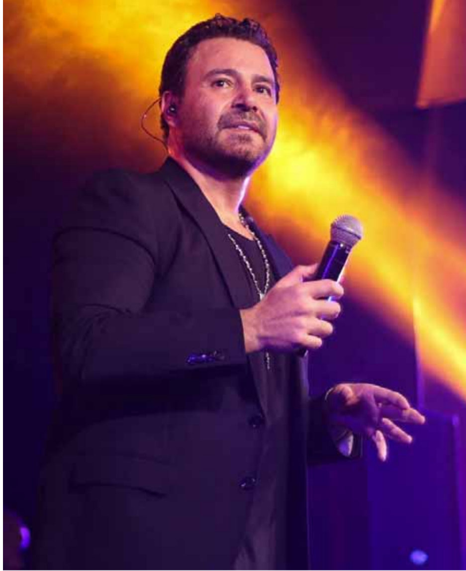
الوطن - «تصوير: وكالة اليباس عيسى»

بدعوة من الكشافة الكنيسية أحيا فارس الغناء العربي عاصي الحلاني حفل فني في فندق الداماروز وسط دمشق احتفالاً بذكرى الميلاد المجيد، وتوجه الحلاني إلى الجمهور السوري في بداية الحفل قائلاً: أتمنى أن تعود سورية كما كانت بل أفضل من قبل ومادام هناك شعب كالشعب السوري ستبقى سورية بألف خير.