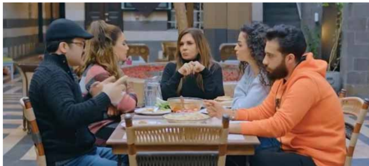
من مسلسل «حواري»، إخراج رشاد كوكش