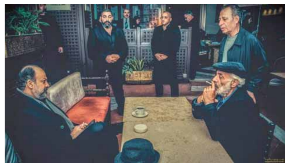
من مسلسل «الفرسان الثلاثة»، إخراج علي المذن

ومن خلال متابعتنا لردود أفعال الجماهير نرى بأن