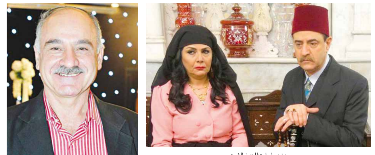
من مسلسل «طاحون الشر»

بد من استمرار عرضه لأنه مطلوب عربياً وهو المسيطر على كل أعمال البيئة الشامية بالمشاهدة العديدة، ورغم الانتقادات التي ليس لها مسوغ سيستمر المسلسل.