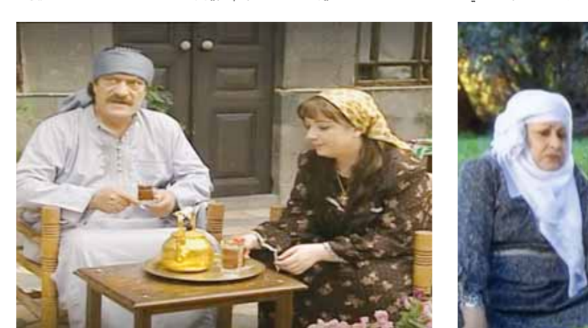
من مسلسل «بيت جدي»

• ما الصعوبات التي تواجه كتّاب أعمال البيئة الشامية بشكل عام؟ يتعرض الكثير من الانتقادات بسبب الصعوبات التي تواجه كتّاب الدراما الشامية أنهم لا يبحفون عن القصص الجديدة لأعمالهم، وأنا أحوال أن أختار قصصاً جديدة وغير مطروحة سابقاً، لكي لا أقلد أحداً ولا استعير.