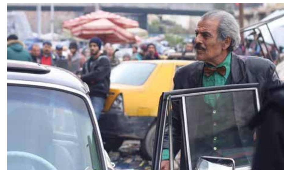
من مسلسل «كانون»

بين الرؤية الواقعية والرومانسية تحاول الدراما السورية أن تعود إلى موضوعاتها