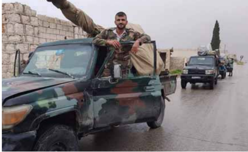
من تعزيزات الجيش العربي السوري في محيط منبج (عن الإنترنت)

على التوالي في ريف حلب الشمالي والشمالي الشرقي، وأشارت المصادر إلى أن التعزيزات الجديدة للجيش العربي السوري إلى منبج، هي الثالثة من نوعها خلال الشهر الجاري، والذي شهد قدوم تعزيزات مشابهة في مطلع وفي الـ منه، الأمر الذي دعم وحداته في التصدي لأي عدوان تركي محتمل. وسحباً منبجاً، هيمن الهدوء الحذر على طول خطوط تماس جبهات القتال شمال وشرق البلاد، وفيما الهدوء الحذر أمس من دون خروقات واسعة من جيش الاحتلال التركي، الذي يبدو أنه يتربص بأوامر إدارة أردوغان التي تجري اتصالات مع موسكو وواشنطن بشأن عملية الغزو البرية المقيدة وغير المحددة بتاريخ إعلان حتى اليوم.