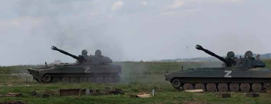
القوات الروسية تتقدم في دونيتسك

الولايات المتحدة، وقال: إن «الطريق طويل أمام بناء عالم متعدد الأقطاب، وفي خضم هذا التحول لن يتوقف التنافس الروسي الأميركي بين لبله وضحاها»، مشدداً على أن هذا التنافس على كل حال يجب أن يقوم على أساس من الاحترام المتبادل.