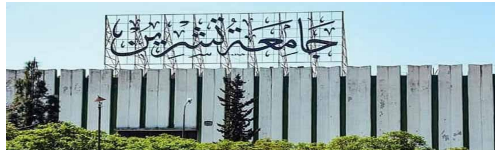
إدراك يد الشريف

فرفت وزارة التعليم العالي استئناف الامتحانات لعدد من الجامعات على أن تكلف الأخيرة بوضع البرامج الامتحانية وتنظيم عملية الدوام.