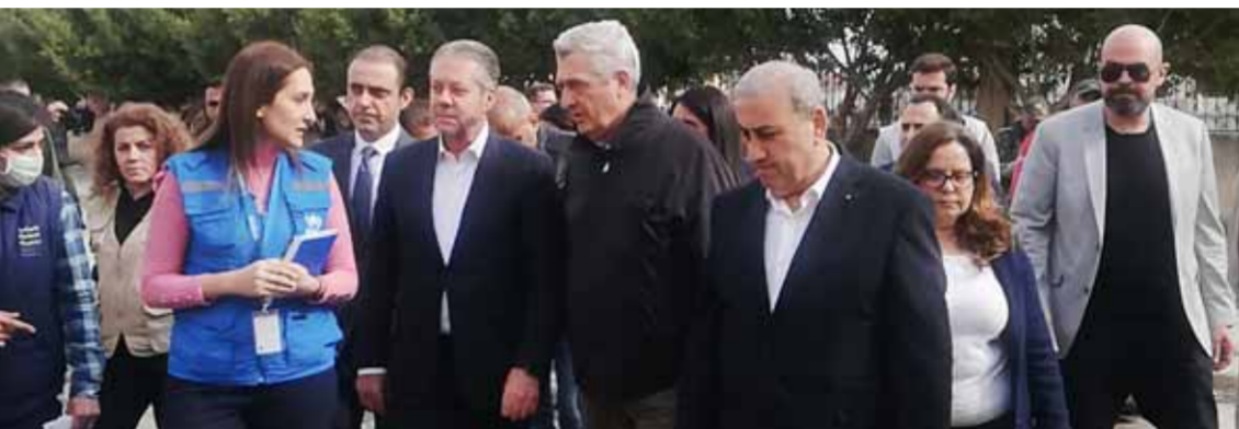
المفوض السامي للأمم المتحدة لشؤون اللاجئين فيليبو غراندي يطلع على أوضاع المتضررين جراء الزلزال في جبلة (سانا)

الحياة ولاسيما الأدوية. وعبر المفوض السامي للأمم المتحدة لشؤون اللاجئين، عن تعازيه الحارة لضحايا الزلزال، لافتاً إلى استمرار المنظمة في تقديم المساعدات، مشيراً إلى وجود موافقة على برنامج مساعدة نقدية جديد بالتنسيق مع المحافظة لمساعدة الأسر الأكثر حاجة من حيث أجور المنازل أو توفير الاحتياجات الأساسية التي تترددها أو عائلة، وأضاف: إن المنظمة تحاول حشد الإمكانات المطلوبة لتعزيز الاستجابة في سورية. من خلال التواصل مع الدول المانحة بما في ذلك المساعدة بتأمين السكن البديل، مشيراً إلى استعداد المفوضية لتقديم خبراتها والمساعدة في مجال التعامل مع هذه الكارثة بفعل الخبرات التي اكتسبتها من التعامل مع الظروف المماثلة. وقال: «بهيئة تعزيز التنسيق والتواصل مع الجهود الحكومية في هذا المجال»، معتبراً أن وجود مكتب المفوضية في اللاذقية يساعد في تفعيل التنسيق المطلوب.