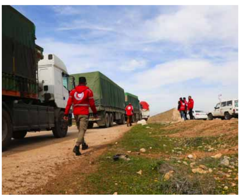
متطوعو الهلال الأحمر ينتظرون عند معبر سراقة لإدخال قافلة مساعدات إنسانية إلى إلب وريفها

حملت ٢٥ طناً من المساعدات الغذائية لمتضرري الزلزال، والثانية إلى مطار دمشق الدولي محملة بالكمية نفسها من المساعدات الغذائية أيضاً. وبذلك يصل عدد طائرات المساعدات الإغاثية والغذائية الواسلة إلى البلاد منذ وقوع كارثة الزلزال حتى مساء أمس إلى ٢٩١ طائرة، منها ١٥٤ إماراتية. وخلال زيارته إلى مستشفى التوليد والأطفال في اللاذقية، أكد رئيس وفد الهلال الأحمر الإماراتي محمد الكعبي في تصريح لـ«الوطن»، استمرار دعم القطاع الصحي في سورية حتى تتعافى وتعود كما كانت، وقال: «لن نقصر في الدعم وسنعمل على تقييم كل مرحلة وفق الاحتياجات الخاصة بها». وأشار، إلى العمل على دعم المشافي السورية بما يلزم سواء الزمر الدوائية أم من التجهيزات وغيرها، والوقوف على كل الاحتياجات وما يتم طلبه من وزارة الصحة السورية، مبيّناً أنه يتم تقييم كل مرحلة من المراحل بدءاً من مرحلة الاستجابة حتى الوصول إلى مرحلة التعافي، وبناء على متطلبات كل مرحلة يتم الدعم بتوفير ما يلزم بشكل سريع وتسليمه مباشرة إلى الجهات المعنية بما يحقق الاستعادة المباشرة. ولقت رئيس وفد الهلال الأحمر الإماراتي إلى دعم القطاع الصحي بأدوية كانت ضرورية خاصة في وجود نقص حاد في الأدوية والمعدات الطبية إضافة إلى تقديم ١٠ سيارات إسعاف مجهزة، وقال: إن «هناك تجاوباً كبيراً وهذه المواد سدت من النقص الكبير في هذا المجال». وأكد الكعبي أن «سورية والإمارات كالجسد الواحد والدعم الإماراتي لسورية هو نفسه فالفرح والحزن واحد والصبر واحد».