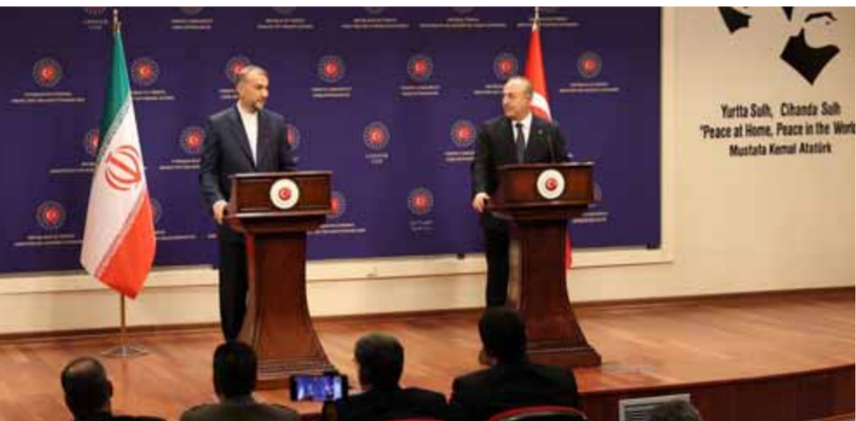
وزير الخارجية الإيراني حسين أمير عبد الهيمان ونظيره التركي خلال مؤتمر صحفي مشترك في أنقرة

يَحط وزير الخارجية الإيراني حسين أمير عبد الهيمان في سورية اليوم، للقاء كبار مسؤوليها، للبحث في تعزيز العلاقات الثنائية والتطورات المرتبطة بالمحادثات الجارية بخصوص انعقاد اجتماع رباعي يضم وزراء خارجية سورية وروسيا وإيران وتركيا. وعلمت «الوطن» أن عبد الهيمان القادم من تركيا، سيبدأ زيارته لسورية من اللاذقية، لتفقد أوضاع المتضررين من جراء الزلزال، وبعدها سيميل إلى دمشق حيث سيلتقي ظهرًا وزير الخارجية والمغتربين فيصل المقداد. زيارة الوزير الإيراني جاءت في سياق عودة الاتصالات الخاصة بإحداث خرق سياسي على خط الوساطة بين دمشق وأنقرة، حيث كشف وزير الخارجية التركي مولود جاويش أوغلو أمس، عن عقد اجتماع لوزراء خارجية سورية وروسيا وإيران وتركيا، في موسكو الأسبوع المقبل تحضيراً لاجتماع الوزراء، وسيشكل هذا اللقاء أول اجتماع سياسي بين مسؤولين من سورية وتركيا منذ بداية الحرب على سورية. جاويش أوغلو قال خلال مؤتمر صحفي مشترك في أنقرة مع عبد الهيمان: إن «اجتماع وزراء الدفاع وروساء الاستخبارات من تركيا