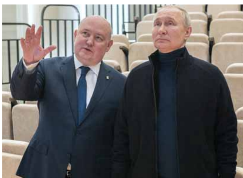
الرئيس الروسي فلاديمير بوتين وحاكم سيفاستوبول ميخائيل رازفوزيف

وين بين، أن شي جين بينغ «سجّري تبادلاً معقداً لوجهات النظر مع الرئيس بوتين بشأن العلاقات الثنائية والقضايا الدولية والإقليمية الرئيسية ذات الاهتمام المشترك»، وأضاف: «حالياً تتطور بسرعة تغيرات لم نشهدها خلال قرن، ويدخل العالم فترة جديدة من الاضطراب»، وتابع أن «الصين ستستمر بموقفها الموضوعي والعالن من الأزمة الأوكرانية، وستتبع دوراً بناءً في تعزيز مبادئ السلام»، وخلال هذه الزيارة، سيبحث الرئيس ترسيخ الشراكة الشاملة والتعاون الإستراتيجي بين روسيا والصين. وصحيفة «غلوبال تايمز» الصينية اعتبرت أن مستوى العلاقات بين البلدين لا يسمح بضغط وتدخل دولة ثالثة، مشيرة إلى أن زيارة الرئيس شي من شأنها تعزيز الثقة الإستراتيجية بين الدولتين. وكتبت الصحيفة الصينية أمس «في السنوات الأخيرة، شاع استخدام اللغة العامة التالية لوصف العلاقات الصينية-الروسية: رفض المواجهة، ورفض استهداف أي طرف ثالث. والان يمكن إضافة مبدأ آخر إلى هذا: العلاقات الروسية-الصينية لا تتسامح مع تدخل أو ضغط من أطراف ثالثة». وقالت الصحيفة: إن زيارة الرئيس الصيني شي جين بينغ إلى روسيا «ستعزز الثقة الإستراتيجية المتبادلة والتعاون المتبادل المنفعة بين الصين وروسيا، وتعود بالفائدة على البلدين وشعبيهما، وتعطي المزيد من الثقة للمجتمع الدولي في مواجهة مخاطر متعددة».