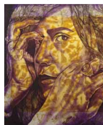
من الأعمال المشاركة