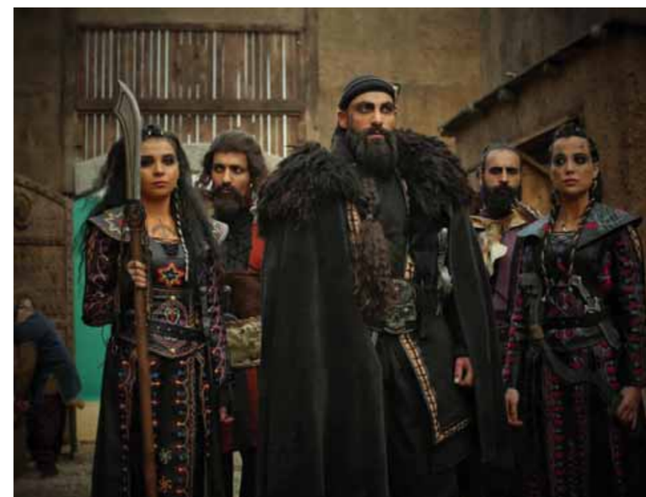
من مسلسل «ذئاب الليل»