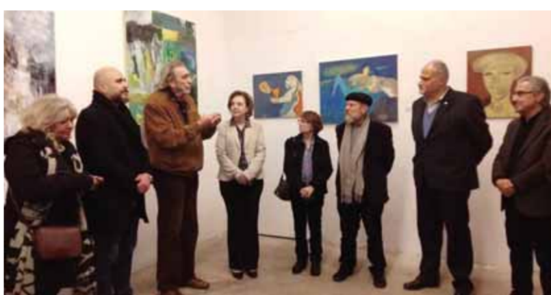
وزيرة الثقافة تتوسط الفنانين المشاركين في تكريم عنتابي

كبير قدم الكثير لهذا البلد إن كان بمجال الإعلان أو المجال البصري، لذلك هو إنسان نادر وأردنا أن نعبر له عن محبتنا بطريقتنا الخاصة. في الحركة التشكيلية السورية حدث شارك في العديد من الأعمال المهمة لوطنه وهو فنان متميز ولكنها لم تعرض في سورية عشقتها في فترة الحرب واستخدمت فيها تقنية خاصة بوقر البرز وغيرها من المواد المختلفة.