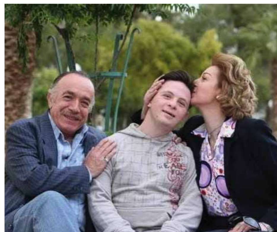
من مسلسل «وراء الشمس»