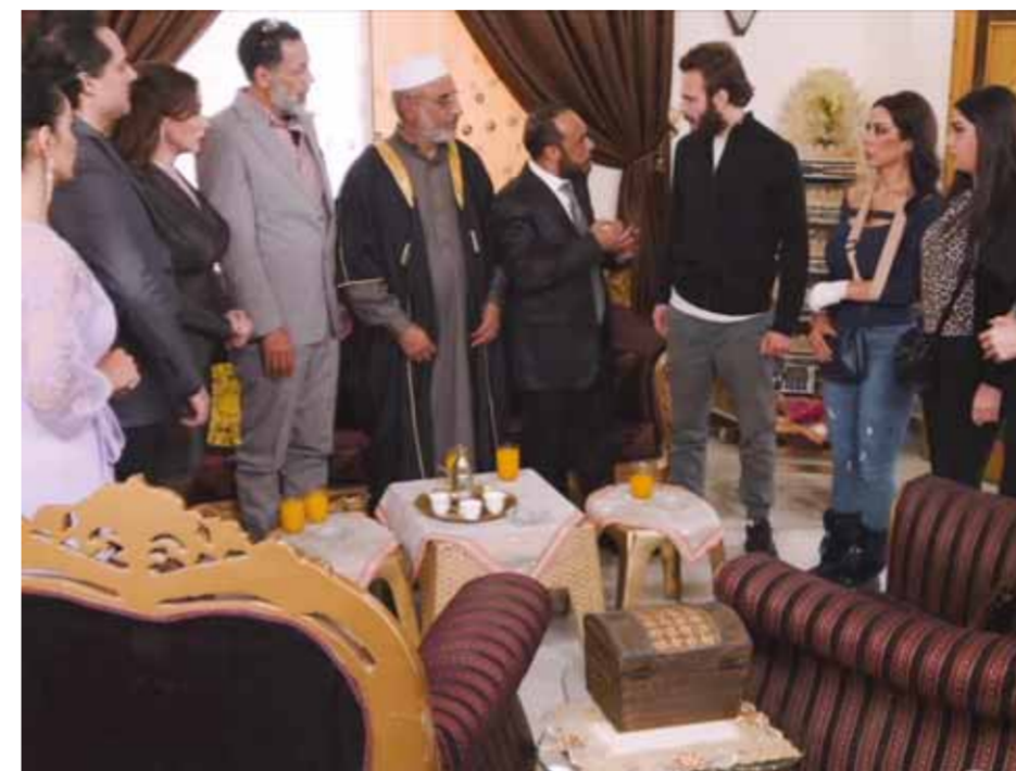
من مسلسل «ضيف على غفلة»