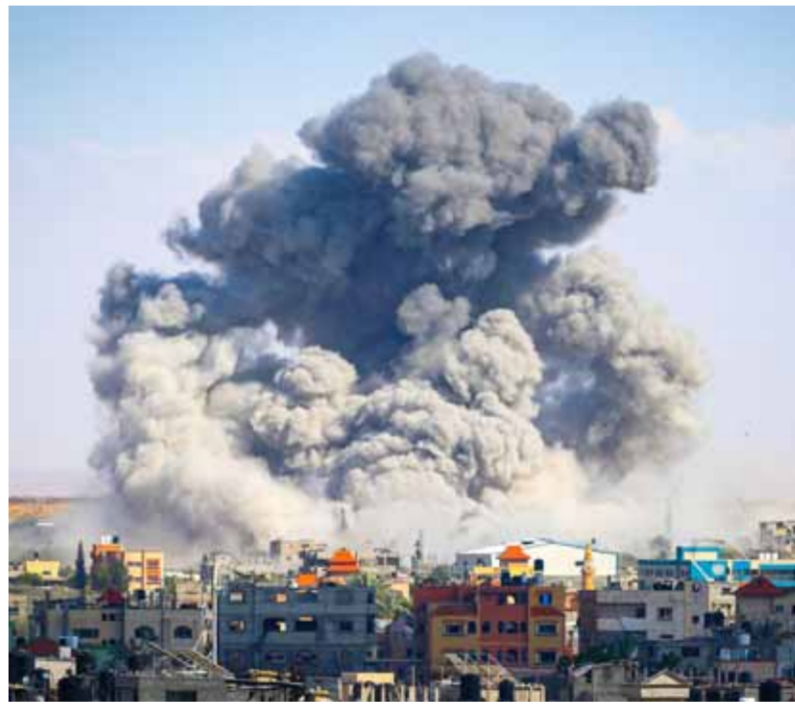
من العدوان الإسرائيلي على مدينة رفح

أن الوسط السياسي في إسرائيل لم يأخذ إعلان حماس قبولها مقترح الهدنة على محمل الجد، مشيرين إلى أن حماس وافقت على صفقة معقدة من المقترح الذي لم توافق عليه إسرائيل بعد. ونقلت «الغداة 12» الإسرائيلية عن مسؤولين إسرائيليين قولهم: «سندرس جواب حماس، الاقتراح الحالي يختلف عن الصفقة التي وافقت عليها إسرائيل»، وأضافوا: «هذا اقتراح بعيد المدى وغير مقبول بالنسبة لإسرائيل»، فيما اعتبر مسؤول حكومي أن إعلان حماس قبول مقترح وقف إطلاق النار هو خدعة تهدف إلى إظهار إسرائيل كقوة متقدمة. وفي وقت لاحق مساء أمس نقلت «رويترز» عن مكتب رئيس وزراء كيان الاحتلال قوله: إن مجلس الحرب قرر بالإجماع استمرار العملية في رفح لضغط على حماس لتحرير الأسرى وتحقيق أهداف الحرب وقال المكتب: «رغم أن مطالب حماس بعيدة عن مطالبنا سنرسل ونفذ للقاء الوسطاء لبحث التوصل إلى صفقة مقبولة».