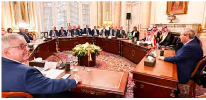
من اجتماع لجنة الاتصال العربية الوزارية في آب الماضي (عن الانترنت)

المقرر انعقاده قبيل القمة في الرابع عشر من أيار الجاري. وأضاف: «لجنة الاتصال العربية الوزارية ستناقش بإسهاب الخطوات المتخذة فيما يخص مبادرة «الخطوة بخطوة» والتي تهدف للتوصل لحل شامل للآزمة السورية، والنتائج التي أفرزتها الاتصالات والزيارات التي جرت مؤخراً ضمن هذا السياق». وكان الاجتماع الأول للجنة الاتصال الوزارية العربية بشأن سورية عقد في القاهرة منتصف آب الماضي. وتضمن الاجتماع كلاً من وزراء خارجية: سورية، الأردن، السعودية، العراق، لبنان، مصر، بالإضافة