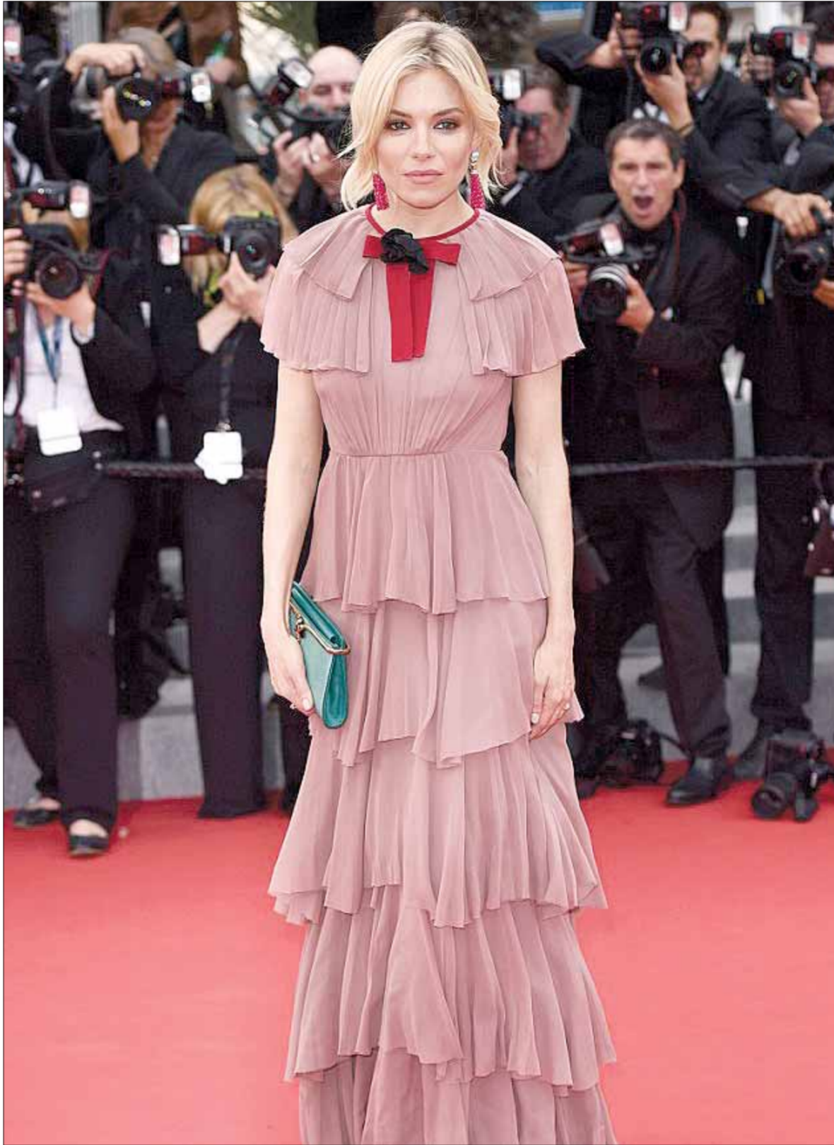
النجمة العالمية سينا ميلر عرض فيلم Macbeth ضمن فعاليات مهرجان كان السينمائي بدورته ٦٨ في جنوب فرنسا، حيث ارتدت فستاناً مميزاً من Gucci.