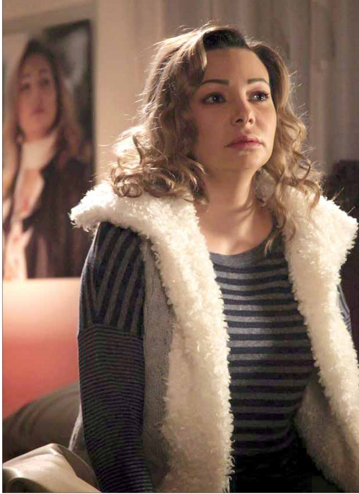
الفنانة السورية ندين تحسين بيك في أحد مشاهد مسلسل «امرأة من رمان» للمخرج نجدة أنزور، حيث تؤدي شخصية «مايا» وهي فتاة طيبة وساذجة لأبعد الحدود، تعاني من مشكلة العنوسة بعد تجاوزها سن ٣٧ عاماً.