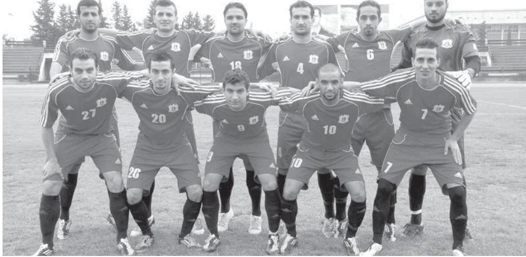
الجيش يمكنه إزاحة القادسية

وفي تذرع لنتائج الجيش في كأس الاتحاد الآسيوي افتتح مبارياته بالفوز على هلال القدس الفلسطيني في الدور التمهيدي لكأس الاتحاد الآسيوي بركلات الترجيح ٥/٤ بعد التعادل السلبي وفاز على الرفاع البحريني ١/١ صفر وتعادل ١/١ وعلى النجمة اللبناني ١/١ صفر و٢/٢ صفر وقاز على الكويت الكويتي ١/١ صفر وتعادل صفر/صفر ولم يخسر أي مباراة بالدور الأول ودخل مرماه هدف واحد فقط وفي الدور الثاني تجاوز الجزيرة الأردني بهدف وحيد في الوقت بدل الضائع من المباراة. أما نتائج القادسية فقد فاز على أمال التركمنستانا ٢/٢ صفر و١/١ صفر، وعلى أربيل العراقي ١/١ صفر وخسر ٢/١، وتعادل مع استقلال دوشنبه ٢/٢ وخسر ٢/١، وفي الدور الثاني فاز على الوحدات الأردني ١/١ صفر.