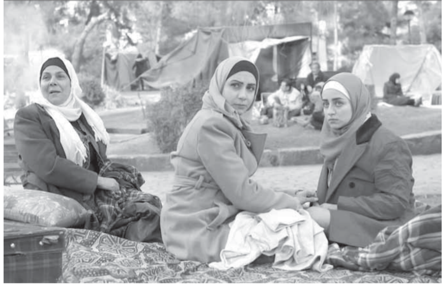
في مسلسل «انتظار الياسمين»