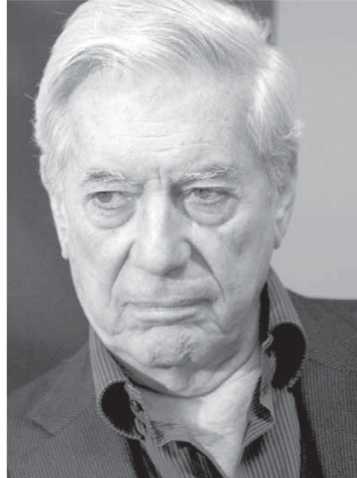
ترجمة: صباح عثمان