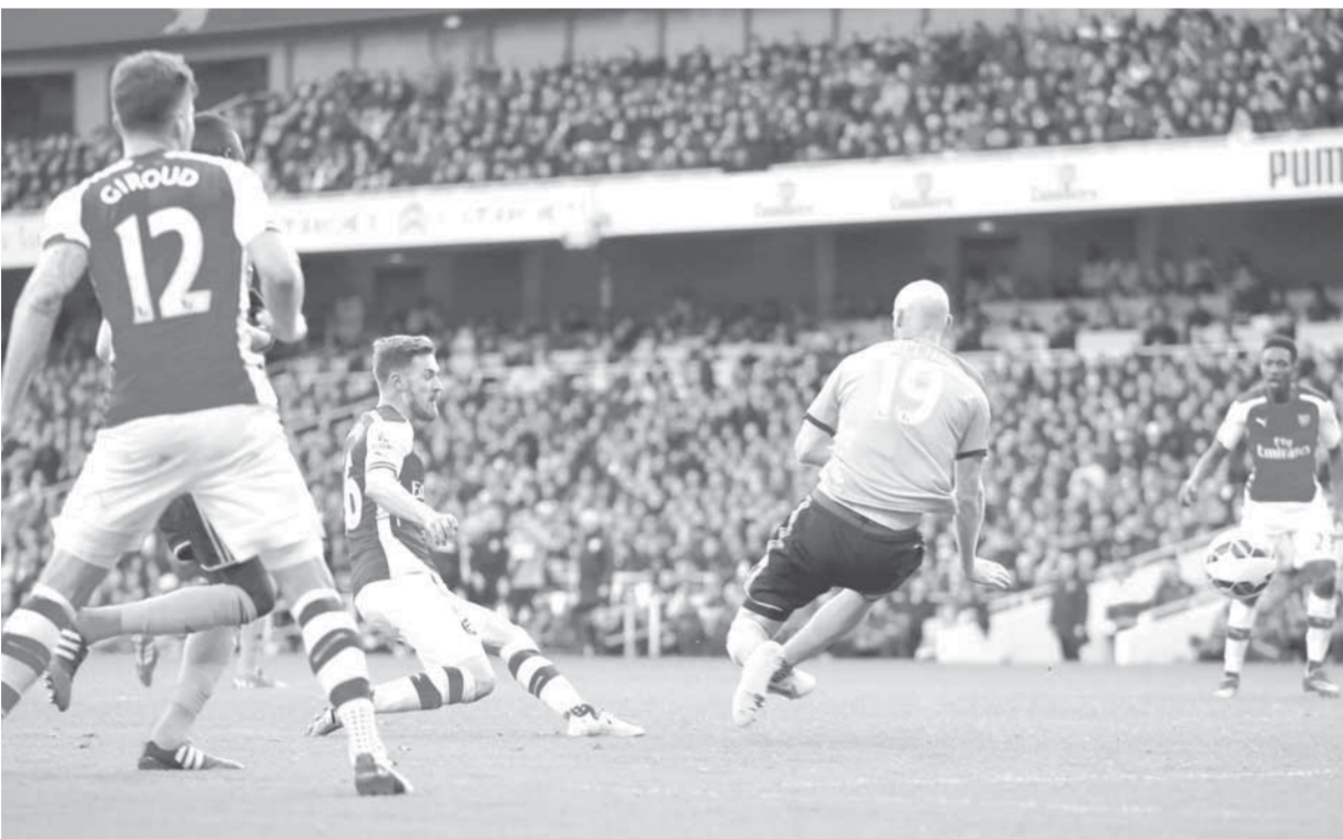
آرسنال يواجه جاره ويستهام