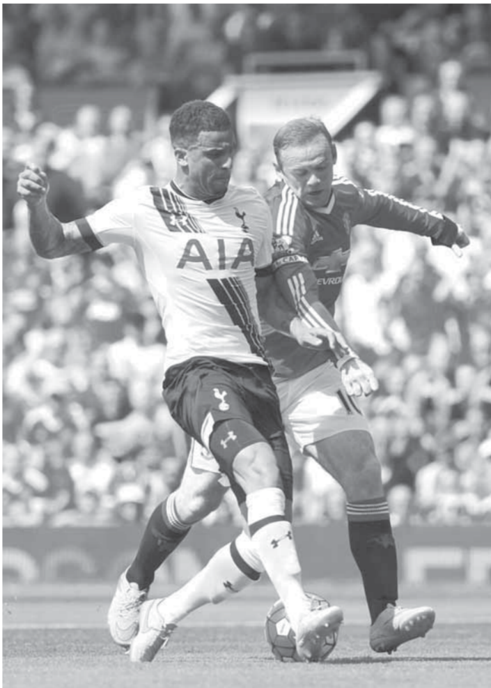
أول أهداف الدوري الإنجليزي عكسي

فرنسا: تولوز × سانت إيتيان، بورنو × ريمس (٦،٠٠)، ليون × لوريان (١،٠٠٠). إنجلترا: آرسنال ويستهام، نوكسل × ساوثمبتون (٣،٣٠)، ستوك × ليدز (٦،٠٠).