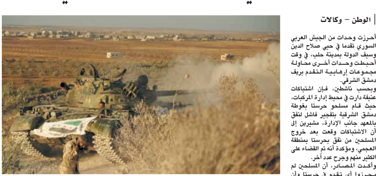
دبابة تستخدمها المجموعات المسلحة في هجومها الفاشل على مدينة درعا

داعش يستعد لمعارك جديدة في الحسكة الجيش يتقدم في حلب.. ويصد هجوماً في حرستا