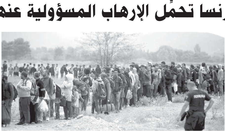
مهاجرون بينهم سوريون يصلون مقدونيا

المجر فالأمر ليس لأنهم في خطر بل لأنهم يريدون شيئاً آخر»، وتابع: إن هدف المهاجرين هو ألمانيا والحياة الألمانية وليس السلامة الجسدية، معتبراً أنه «من دون وجود ضوابط تستشكّل اللاجئين عبئاً مالياً غير محتصل على الدول الأوروبية وأن هذا سيؤثر في دول الرخاء المسيحية في القارة».