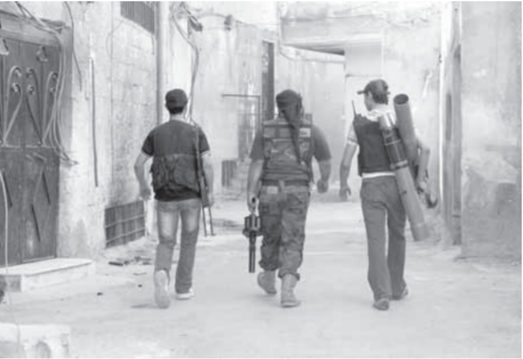
مسلحون في العسالي في دمشق