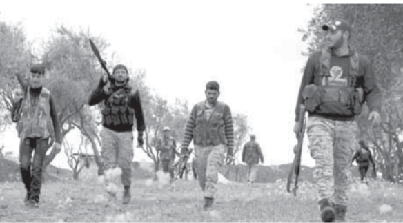
مسلحون إرهابيون قرب مارع في حلب

وعلياتها في مدينتي الباب وجرابلس من دون إحرار أي نتيجة. وخاب ظن حكومة «العدالة والتنمية» الانتقالية من مواليفها من المجموعات المسلحة التركمانية والتي عولت عليها في حماية «المنطقة الآمنة» كشرطي مرور لكنها لم تقدر على مواجهة داعش في أي نزاع حتى إن عناصرها فروا بمساعدة حرس الحدود التركي إلى داخل الأراضي التركية في مواجهات خفيفة، ما أثار موجة انتقاد واسعة من بقية المجموعات التي انزعجت من تسويق تلك المجموعات على حسابها.