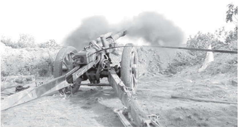
الإرهابيون يطلقون قذائف مدفعية في ريف ادلب

وتتمتكت الجبهة خلال الحملة من إنهاء وجود المجموعتين في المحافظة بشكل شبه كامل، باستثناء بعض المسلحين الذين اندمجوا داخل مجموعات أخرى لميليشيا «الحر» في ادلب وحلب.