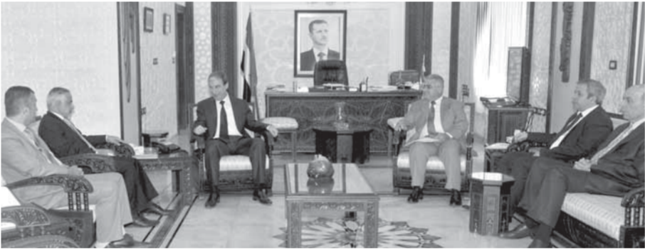
لقاء وزير الثقافة مع مدير مكتب اليونسكو الاقليمي (سانا)

خلال الضغط على المنظمات الدولية وغيرها وممارسة مسؤولياتها الأخلاقية والقانونية في حماية هذه الآثار عبر الدفع والاستجابة لقرار مجلس الأمن المرتبط بتجريم ومنع الاتجار بالآثار السورية وبيعها.