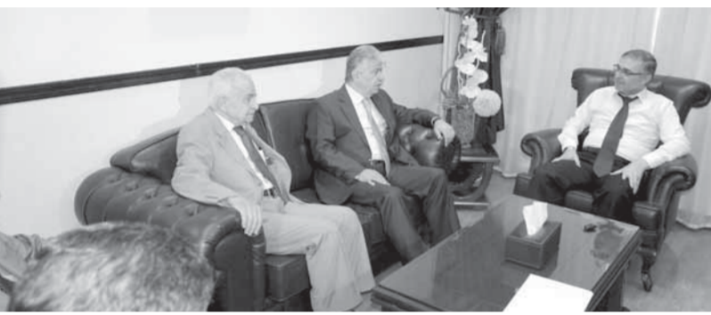
وزير المصالحة الوطنية ملتقى وفد منظمة التحرير الفلسطينية