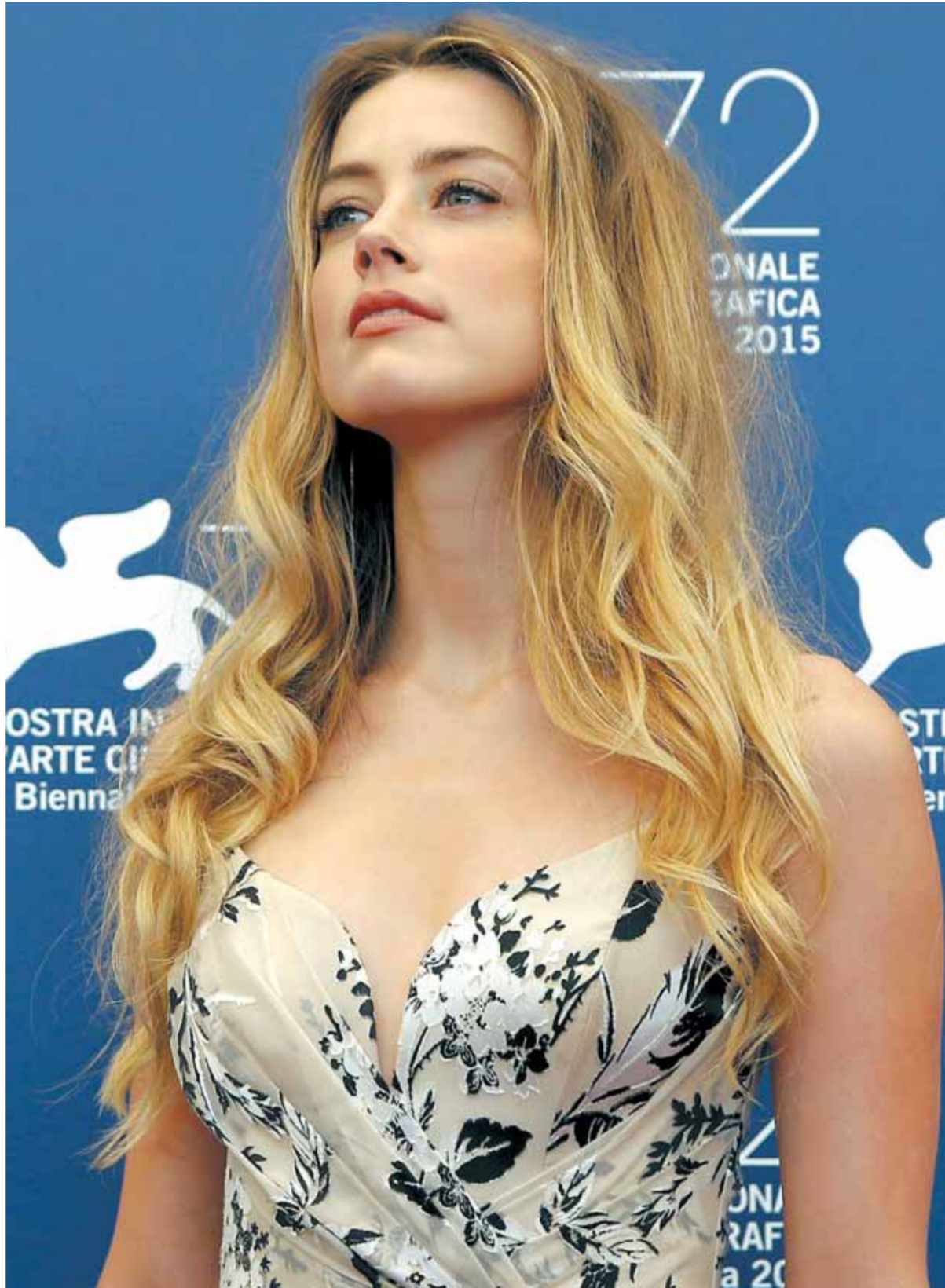
الممثلة الأميركية أمبر هيرد خلال العرض الأول لفيلم "The Danish girl" في مهرجان البندقية السينمائي الثاني والسبعين