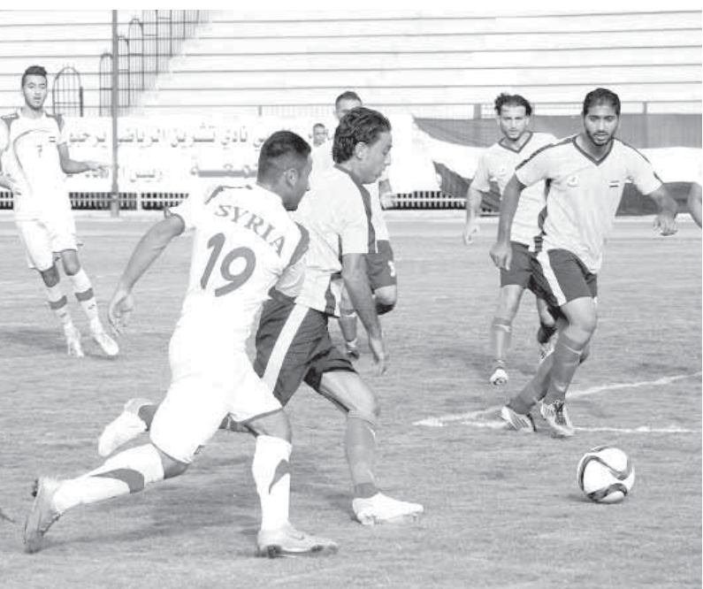
من مباراة منتخب ناشئي سورية والكرامة

مباراة فيها ٣ أهداف مقابل ١،٧٥ هدف بكل مباراة في المجموعة الثانية بينما بلغ معدل التسجيل بالمباريات الفائتة ٢،٣٧ بالمباراة الواحدة.