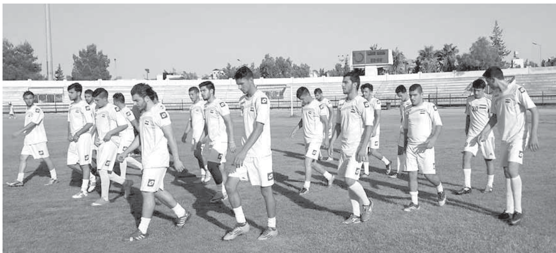
شبابنا سقطوا بقسوة