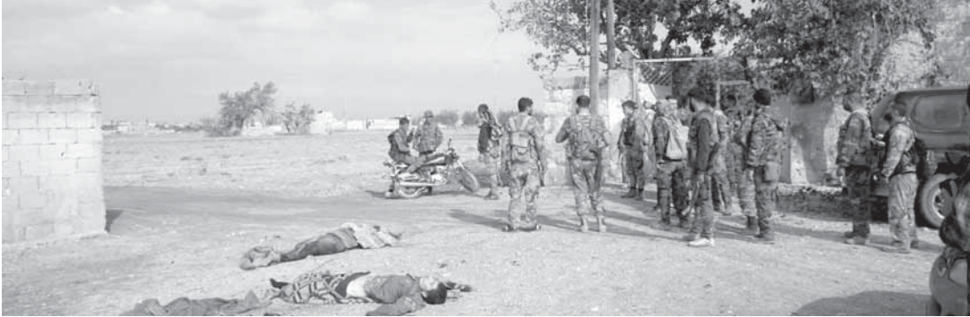
وحدات من الجيش تقضي على إرهابيين من داعش تسللوا إلى مزارع السفيرة في ريف حلب

من جهة أخرى أطلقت مجموعة إرهابية عدة قذائف صاروخية على مدينة محررة صباح أمس، واقتصرت الأضرار على المدايات فقط.