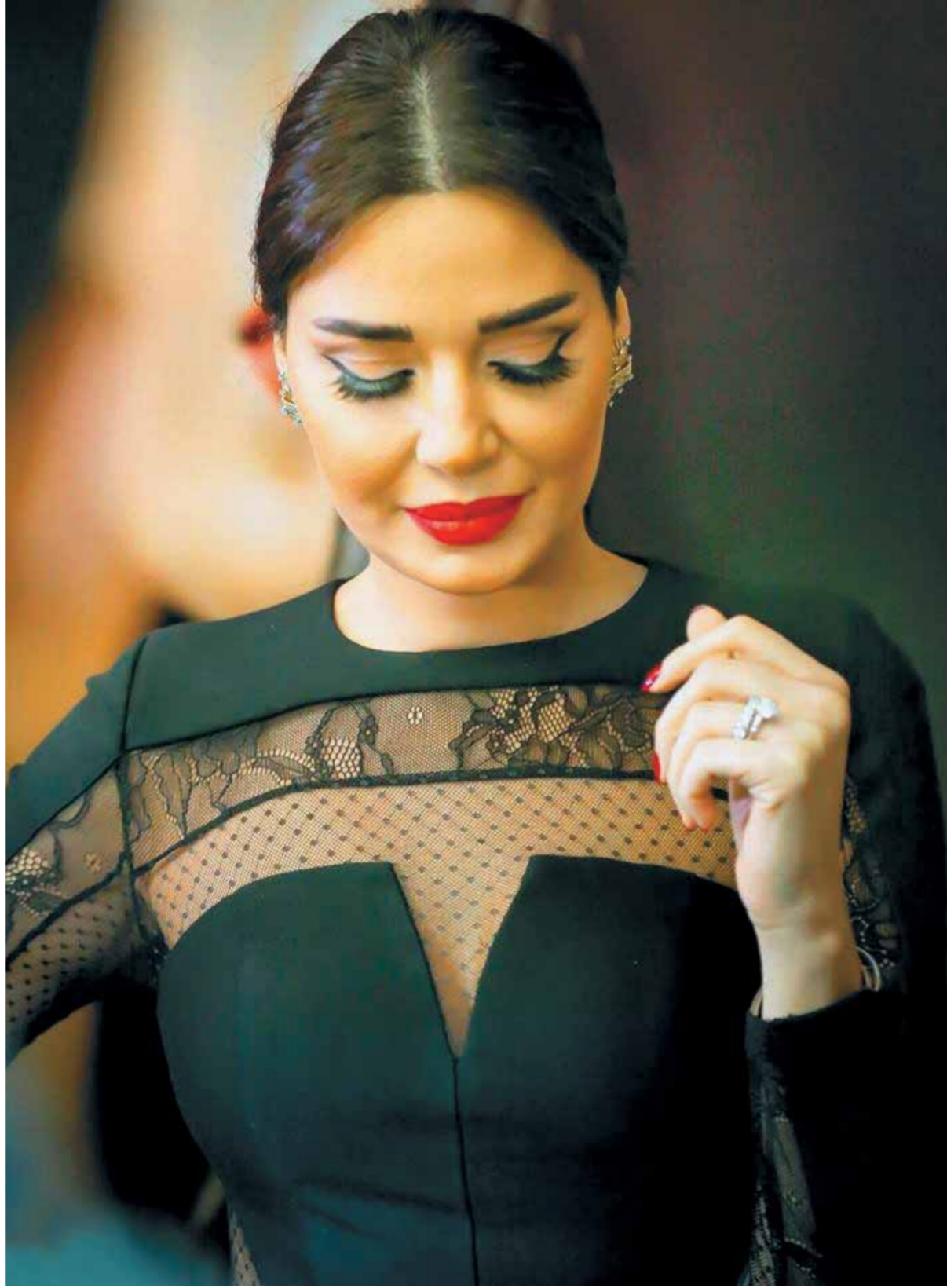
الفنانة اللبنانية سيرين عبد النور خلال حضورها عرض أزياء Dolce Farfalla في مجمع الForum de Beirut وسط بيروت، وبدت أتيقة بفسانها الأسود.