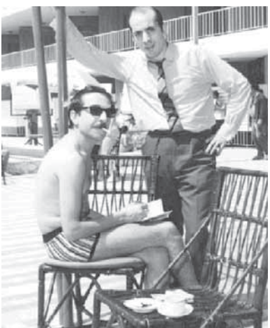
مع الفنان دريد لحام