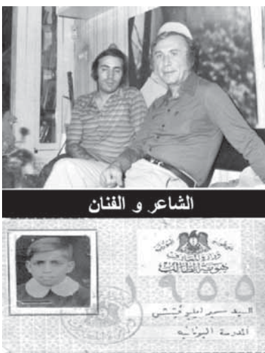
الشاعر و الفنان