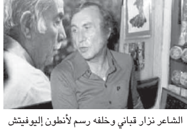
الشاعر نزار قباني وخلفه رسم لأنطون إيوفيتش