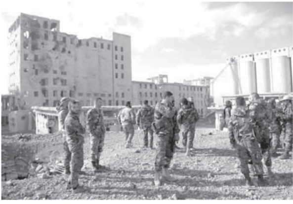
إحكام الجيش السيطرة على صوامع الحبوب بقرية رسم العبد بريف حلب

حميمة الكبرى التي سيطر على أجزاء منها ليقطع شوطاً جديداً في الهيمنة على مسافة أطول من طريق عام حلب الرقبة الذي بات مقطوعاً في وجه التنظيم منذ أيام. تلويسبت الجيش سيطرته على صوامع الحبوب الضخمة في رسم العبود ومسكن الموظفين قريبا بعد يوم من سيطرته على بلدة عاكودة، يصبح الأفق مفتوحاً أمامه لرصد بلدة دير حافر نارباً وكذلك قرية أم أركيلة ورسم العبد جنوب المطار الذي يك الحصار والبساتين المحيطة بهما في ريف