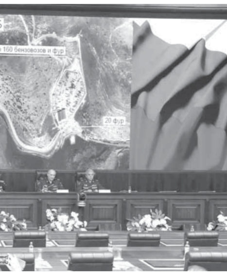
المؤتمر الصحفي وتظهر في الصورة مشاهد تثبت بيع داعش النفط السوري المسروق لتركيا

كما دعا أنطونوف القيادة التركية إلى السماح بتفتيش المناطق التركية التي تشير بيانات وزارة الدفاع الروسية إلى وجود عقد لتهريب النفط الداعشي فيها. وتوقع أن يزعم الجانب التركي أن جميع المواد التي عرضتها وزارة الدفاع