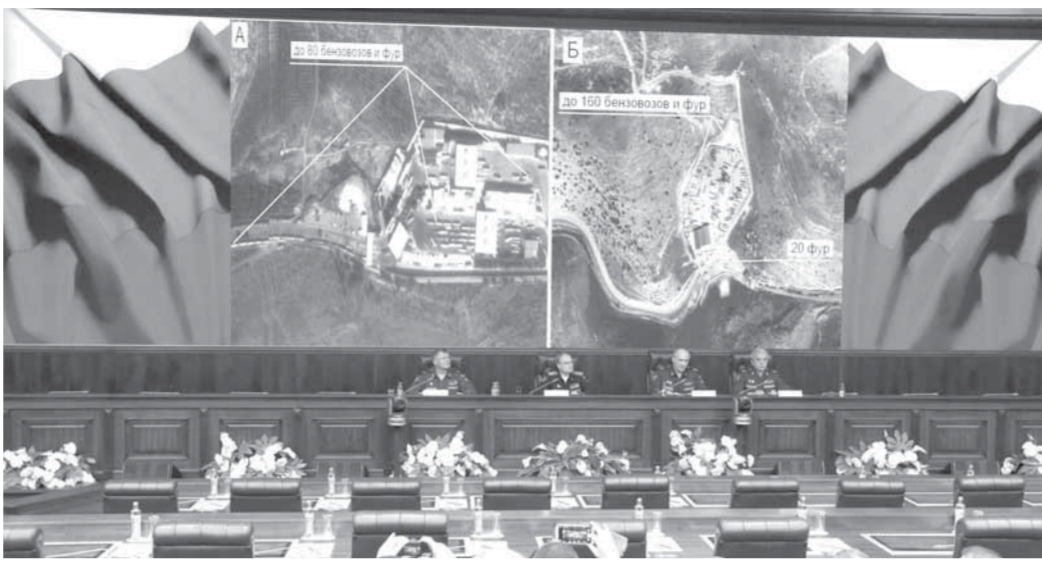
المؤتمر الصحفي وتظهر في الصورة مشاهد تثبت بيع داعش النفط السوري المسروق لتركيا

وأكد أن الاتجار بالنفط يمثل المصدر الرئيس لتمويل الإرهابيين في سورية، وشدد على أنه لإلحاق الهزيمة بداعش يجب توجيه ضربة صارمة إلى مصادر تمويله. لكنه قال إن الجانب الروسي لا يلاحظ أي غارات من جانب التحالف