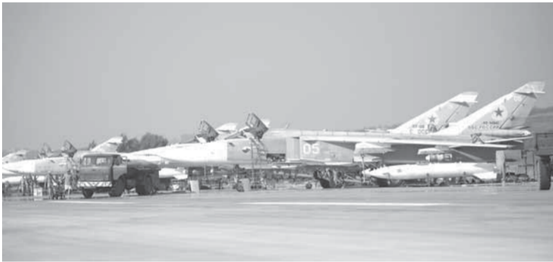
مقاتلات روسية في مطار حمصيم في اللاذقية

وتير معلة ومناطق أم شروشوح وغرناطة والغجر بريف مدينة الرست إضافة لاستهداف مقر عمليات إحدى التنظيمات المسلحة التابعة لـ«النصرة»، في منطقة الحولة شمال غرب المحافظة. وأكد المصدر تدمير هذا المقر بشكل كامل بما كان داخله من مسلحين وعدة معقل وأوكار أخرى وعدة عربات ودرجات نارية على تلك الاتجاهات وإيقاع عدد كبير من المسلحين بين قتل وجرح. وفيما بدأ دليلاً على ثوبت قناة الجزيرة القطرية مع المجموعات المسلحة، أكد ناشطون على «فيسبوك» إصابة مصور القناة بنيران الجيش العربي السوري في منطقة تلدو بالريف الشمالي.