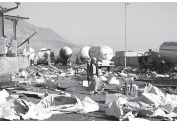
الدمار الذي خلفته غارة سعودية على صنعاء

وعلى الحدود اليمنية السعودية، قال مصدر عسكري يمني إن قوات الجيش واللجان الشعبية قصفت معسكر العزّاب وتجمعات القوات السعودية في الطوال وموقع السرداح في جيزان. في غضون ذلك أقدم مسلحون ينتمون لتنظيم القاعدة على رجم امرأة حتى الموت بتهمة الزنى والقيادة، في مدينة المكلا التي يسيطر عليها في جنوب شرق اليمن، بحسب ما أفاد شهود