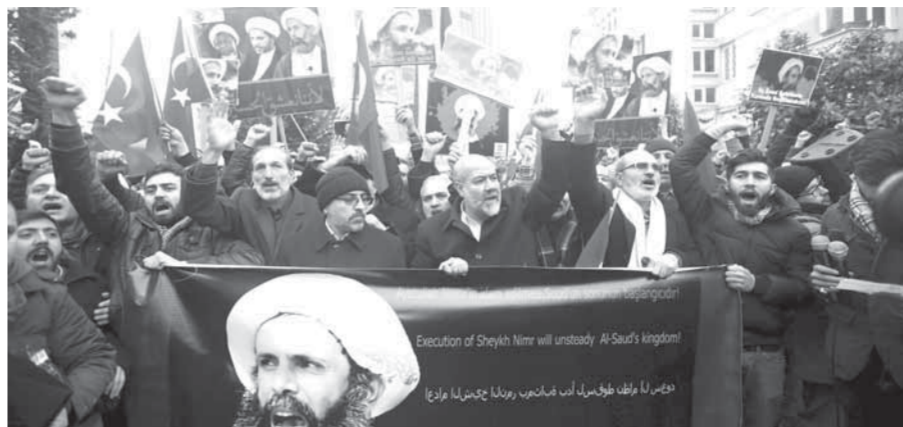
احتجاج أمام القنصلية السعودية في اسطنبول بعد إعدام الشيخ النمر