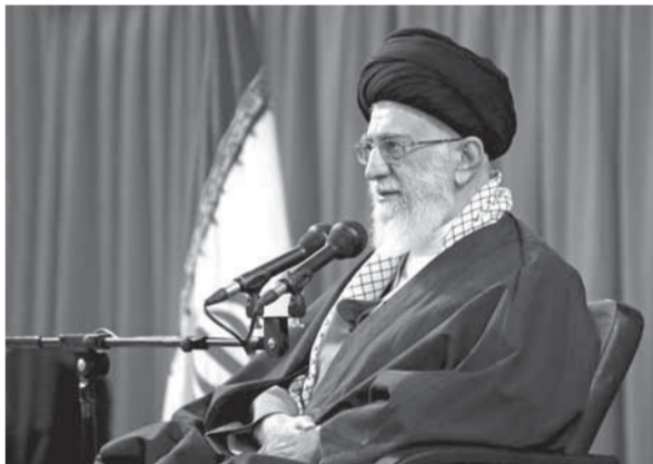
المرشد الأعلى للجمهورية الإيرانية علي خامنئي

إلا أن مصادر أمنية أفادت لوكالة «فرانس برس» أن الاشتباكات اندلعت عندما حاولت السلطات «إخبال قوات (والية لهادي) تم تدريبها من قبل التحالف في الميناء، مع قوبل برفض من مسلحين موجودين فيه، وادى إلى اندلاع الاشتباكات».