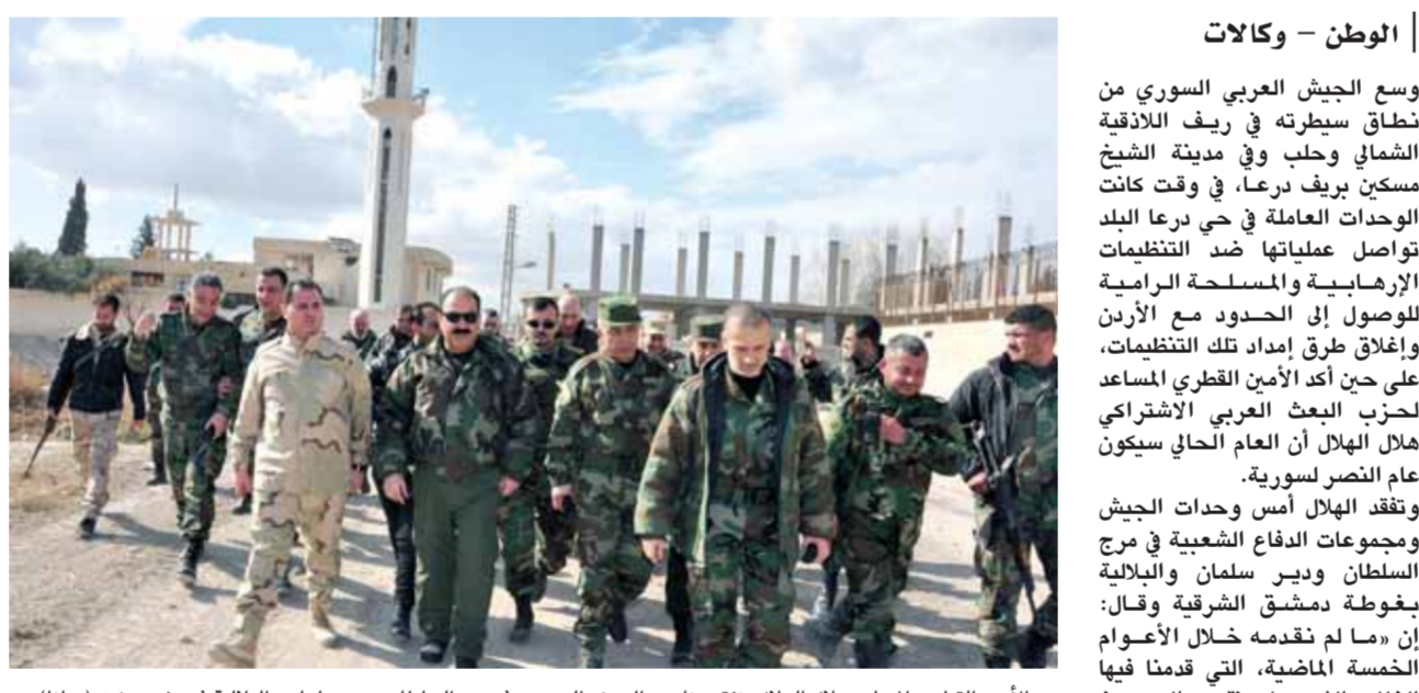
الأمين القطري مساعد هلال الهلال يتفقد عناصر الجيش السوري في مرج السلطان ودير سلمان والبلابية في ريف دمشق

وسع الجيش العربي السوري من نطاق سيطرته في ريف اللاذقية الشمالي وحلب وفي مدينة الشيخ مسكين بريف درعا، في وقت كانت الوحدات العاملة في حي درعا البلد تواصل عملياتها ضد التنظيمات، الإرهابية والمسلحة الرامية للوصول إلى الحدود مع الأردن وإغلاق طرق إمداد تلك التنظيمات، على حين أكد الأمين القطري المساعد لحزب البعث العربي الاشتراكي هلال الهلال أن العرب الحالي سجون عام النصر لسورية. وتفقد الهلال أسس وحدات الجيش ومجموعات الدفاع الشعبية في مرج السلطان ودير سلمان والبلابية بغوطة دمشق الشرقية وقال: إن «ما لم تقدمه خلال الأعوام الخمسة الماضية، التي قدما فيها الغالي والنفيس، لن نقدمه اليوم»، إشارة إلى مفاوضات جنيف، وتابع: «تحقق هذا النصر بفضل جهودكم ومقاومتكم»، وذلك بحسب ما نقلته عنه «الفضائية السورية». وفي موضوع متصل، أكد ناشطون على «فيسبوك» مقتل القائد الميداني لجبهة النصرة «أبو حمزة المعاني»، ومقتل قائد «شهداء لواء الإسلام» جمال النقيب في الغوطة الشرقية بريفص جنوب الجيش، الأمر الذي رده عليه مساندو «جيش الإسلام» بحسب ما نقله هاون اطلقوهما في