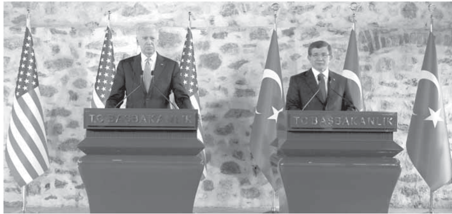
أحمد داود أوغلو و جو بايدن خلال مؤتمر صحفي مشترك في اسطنبول

نظام أردوغان حيث وجه في تشرين الأول من عام ٢٠١٤ وفي سياق متصل أوضح كيليتشار أوغلو أمس في اجتماع الأول للجنة التنفيذية التي تم انتخابها الأسبوع الماضي في المؤتمر العام لحزب الشعب للتنظيمات الإرهابية في سورية.