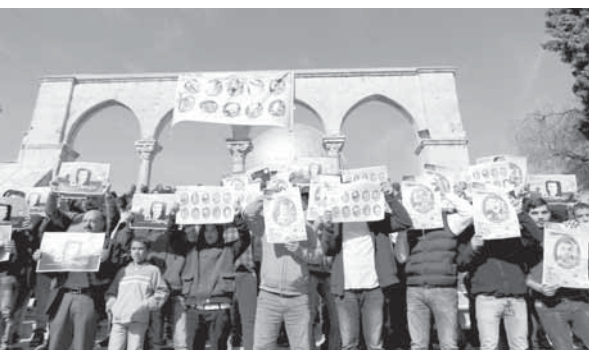
تظاهرة في الحرم القدسي الشريف