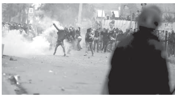
خلال احتجاج الماطلين عن العمل في تونس

قال رئيس الحكومة التونسية الصيد أمس السبت: إن ما قامت به الحكومة لحل المشاكل الاقتصادية «غير كاف»، واعدت بالعمل أكثر لإيجاد حلول. وفي مؤتمر صحفي قال الصيد: «اجتمعنا في مجلس الوزراء ودرسنا الوضع وستبقى جلساتنا مفتوحة، محذراً من أي جهة داخل أو خارج البلاد «لن نستطيع المس بالمخاسب الديمقراطية في تونس».