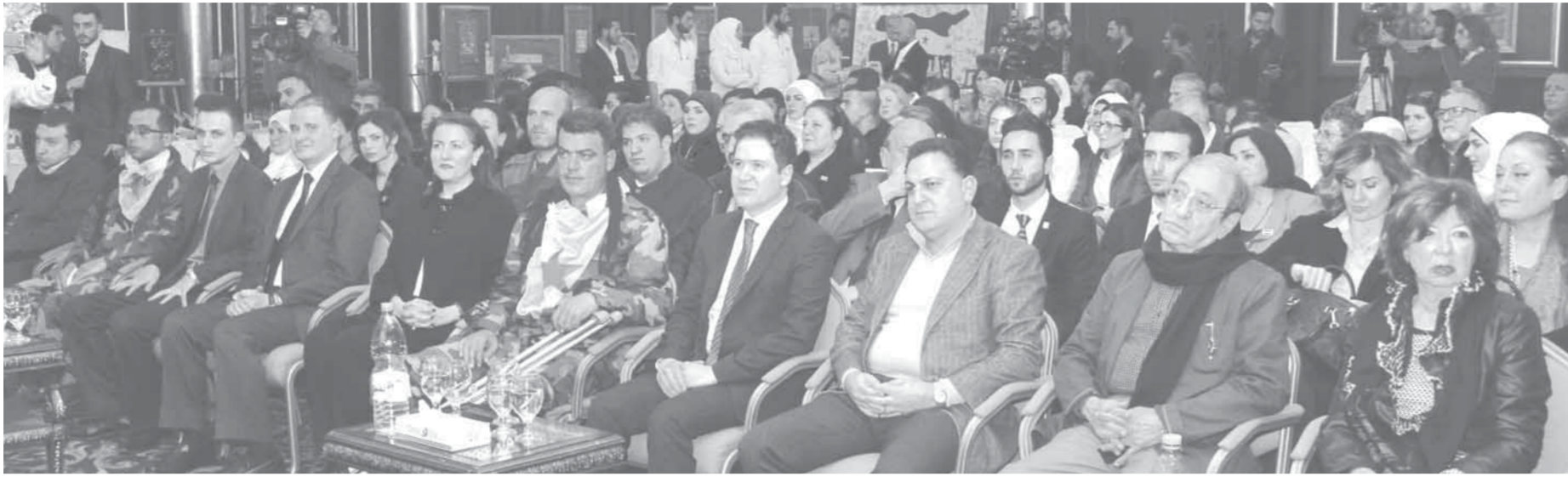
جانب من الحضور في افتتاح معرض «صامدون رغم الجراح»