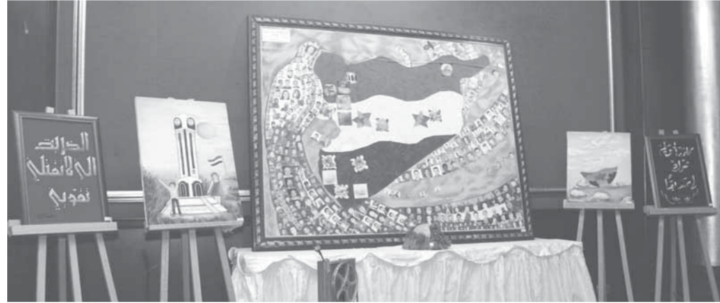
من الأعمال المعروضة في معرض «صامدون رغم الجراح»