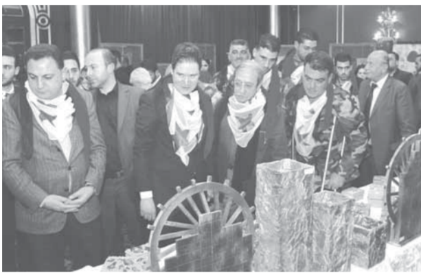
وزير السياحة والفنان دريد لحام يجولان في أنحاء المعرض