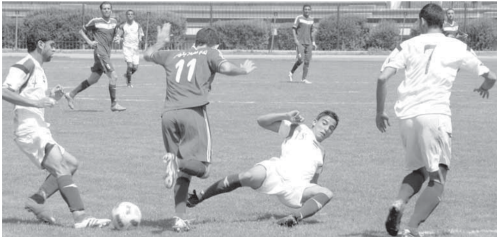
المصفاة تراجع كثيراً