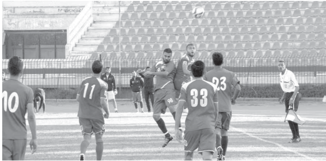
الاتحاد تعذب أمام الفتوة واللطة من الذهاب

فالدوري السوري يجري بلا قوانين وليس له أي منطق.