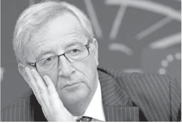
المحدث باسم المفوضية الأوروبية مارغاريتيس شيناس