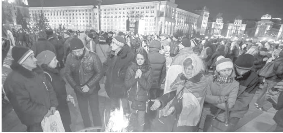
احتجاج ضد الحكومة في كيف

تعر فيه أوكرانيا بمرحلة حرجة في الأزمة السياسية المستمرة منذ أشهر، وتحديداً بعد أن رفض رئيس الوزراء أرسيني ياتسنيوك الاستقالة، رغم مطالب الرئيس بوروشينكو، وانتهيار التحالف الحاكم إثر إخفاق مجلس النواب في سحب الثقة عن حكومة ياتسنيوك. وكانت العلاقات بين بوروشينكو وياتسنيوك متأزمة دامتاً، ولاسيما منذ الانتخابات البرلمانية الأخيرة في خريف العام ٢٠١٤، التي تقدم فيه حزب ياتسنيوك على كتلة بوروشينكو. وعلى الرغم من أن الرجلين تمكنا في البداية من تسوية أو إخفاء خلافاتهما، يبدو أن نزاعهما العلني الأخير أطلق دوامة الأزمة السياسية من جديد.