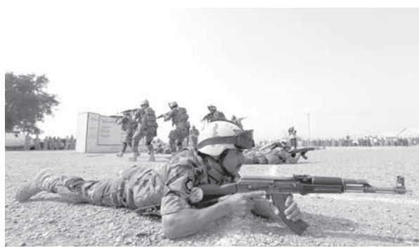
عرض عسكري خلال حفل التخرج في معسكر التاجي في بغداد

إلى ذلك أحبطت القوات العراقية المشتركة هجوماً إرهابياً تنظم داعش على الطريق الدولي السريع شرق الرمادي بمحافظة الأنبار وقضت على ٤٦ إرهابياً. وأفاد قائد عمليات الأنبار اللواء منتصف تشرين الأول ٢٠١٤. وتشن القوات العراقية بمساندة من الحشد الشعبي، ومقاتلين من عشائر الأنبار ودعم من التحالف الدولي عمليات متلاحقة في مناطق متفرقة ضد الإرهابيين في الأنبار.