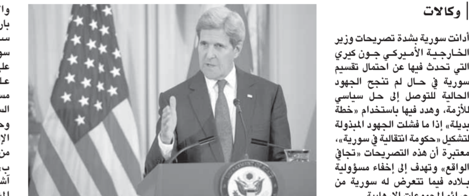
كيري خلال مؤتمر صحفي في واشنطن

أدانت سورية بشدة تصريحات وزير الخارجية الأميركي جون كيري التي تحدث فيها عن احتمال تقسيم سورية في حال لم تنجح الجهود الحالية للتوصل إلى حل سياسي للأزمة، وهدد فيها باستخدام «خطة بديلة» إذا ما فشلت الجهود المبذولة لتتمكين «حكومة انتقالية في سورية»، معتبرة أن هذه التصريحات «تجافي الواقع» وتهدف إلى إخفاء مسؤولية بلاده فيما تعرض له سورية من جرائم المجموعات الإرهابية. من جانبها رأت روسيا أنه من السابق لأوانه الحديث عن أي خطط بديلة، قائلةً عليها بوجود أي خطة أميركية بديلة، وسط تقارير صحيفة أميركية تحذر واشنطن من أن «الخطة ب» قد تجرّها إلى الحرب بالوكالة في سورية بشكل أعمق. وقال مصدر رسمي في وزارة الخارجية والمغتربين في تصريح، نقلته وكالة «سانا» لأخباره أمس، تعليقا على التصريحات التي أدلى بها كيري في مجلس الشيوخ الثلاثاء، والتي تحدث فيها عن «إطالة الأزمة» في سورية واحتمال التقسيم: إن «الجمهورية العربية السورية تدين هذه التصريحات التي تجافي الواقع وتأتى في سياق التضييل لإخفاء مسؤولية بلاده فيما تعرض له سورية من جرائم المجموعات الإرهابية». وأضاف المصدر: إن «الولايات المتحدة وحلفاؤها وأنواتها الإقليمية تتحمل مسؤولية اندلاع الأزمة في سورية واستمرارها، وذلك من خلال مواصلة دعم الإرهاب وعدم أداء دورها بعض دورها في مجلس الأمن لفرص تطبيق قرارات المجلس ذات الصلة بمعاقبة الإرهاب وخاصة من جانب السعودية وتركيا اللتين تشكلان خزان الطاقة في المنطقة والمقاومة المسلحة للإرهاب». وأكد المصدر، أن سورية وشعبها