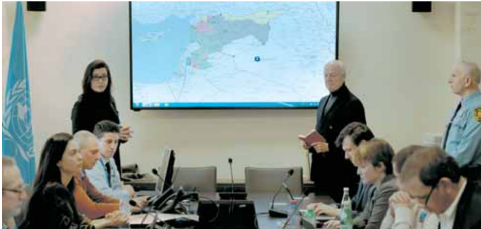
دي ميستورا يشارك في اجتماع في مركز عمليات في جنيف يوفر اتصالات ودعم لوقف إطلاق النار

ووافق مجلس الأمن بالإجماع على القرار ٢٢٦٨ الخاص بوقف الأعمال القتالية وكان نسخاً عن بيان ميونخ الروسي الأمريكي المشترك ودعا مجلس الأمن البعث الأممي ستيفان دي ميستورا لإسراع في استئناف الحوار السوري السوري الذي حدد في ٧ من آذار المقبل في جنيف، على أن يستمر ثلاثة أسابيع، مع التأكيد على ضرورة أن يكون تمثيل المعارضة شاملاً ويتضمن ممثلين عن مؤثرات موسكو والقاهرة والبراض، ما يقطع الطريق أمام انحياز دي ميستورا للوفد الرياض دون سواه والإزامه بالتفكير الشامل كما نص عليه القرار ٢٢٥٤ السوري، لأنهم «ليسوا الجولاني»!