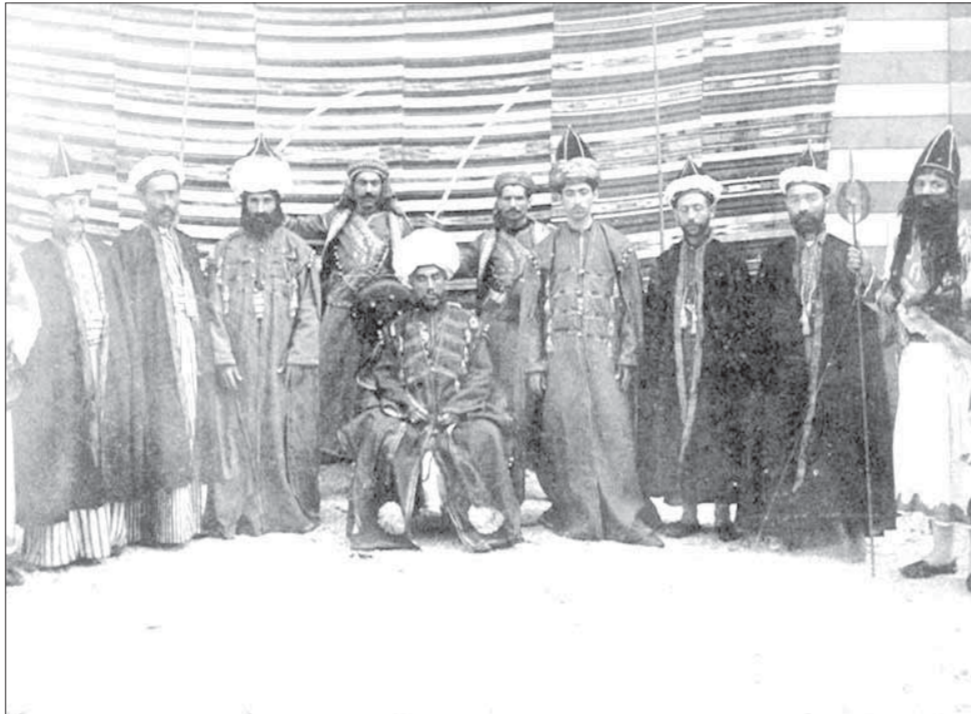
من مسرحية عرضت في شيكاغو 1892

في مرحلة الثلاثين من عمره أصبحت الخبرة أكبر والتجربة أنضج لدى «أبي خليل القباني» في ميدان المسرح من جهة والتلحين والموسيقى من جهة أخرى، وفي