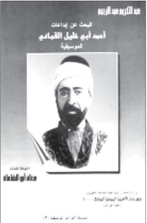
من كتاب عن الإبداعات الموسيقية

فيما بعد جاءت عروضه متتالية بعد أن لاقى النجاح والإقبال من الجمهور في دمشق وما حولها، فقدم عروضاً مسرحية وغنائية، وتمثيليات عديدة منها: «ناكر الجميل»، و«هارون الرشيد»، و«عايدة»، و«الشاه