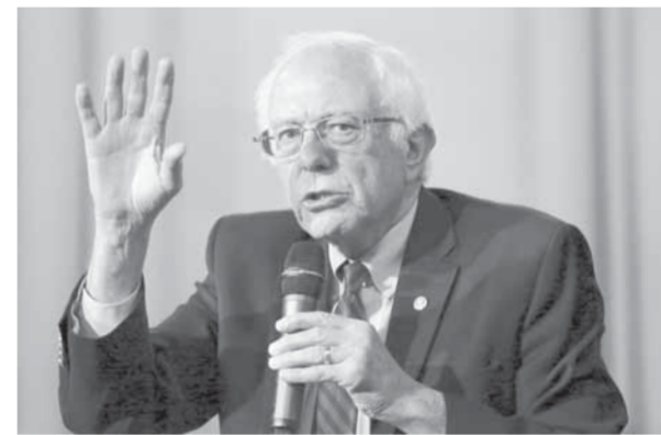
مرشح الحزب الديمقراطي بيرني ساندرز

كسر بيرني ساندرز مرشح الحزب الديمقراطي المحرمات في الحملة الانتخابية الأميركية عندما أعلن أن رد إسرائيل كان غير متكافئ خلال حرب صيف العام ٢٠١٤ في قطاع غزة. وشكلت ملاحظاته خلال المناظرة التلفزيونية للمرشحين الديمقراطيين في ١٤ نيسان في نيويورك انتقاداً غير مسبق لإسرائيل وترويجاً لحقوق الفلسطينيين من أحد مرشحي الرئاسة الأميركية. وقال السناتور عن ولاية فيرمونت: إن رئيس الوزراء الإسرائيلي بنيامين نتنياهو «ليس دائماً على حق» لا يمكننا أن نظل منحازين على الدوام». وانتقد ساندرز خلال المناظرة منافسته الديمقراطية هيلاري كلينتون لعدم قولها بأنها ستفعل المزيد لتعزيز حقوق الفلسطينيين عندما تحدثت أمام لجنة الشؤون العامة الأميركية الإسرائيلية (إيباك) في واشنطن في آذار، وقال ساندرز: «إذا أردنا إحلال السلام في هذه المنطقة التي شهدت الكثير من الكراهية والحرب فستعين علينا معاملة الشعب الفلسطيني باحترام وكرامة». وساندرز هو المرشح الرئاسي اليهودي الوحيد العام الحالي. وسبق له أن عاش في إسرائيل. ومن جانبه قال دانييل سيرايسكي من منظم مجموعة «يهود ليبرتي» التي لديها ثمانية آلاف من المؤيدين في الفيسوك إن تصريحات ساندرز لا تثير الاستغراب في البلدان الأخرى،