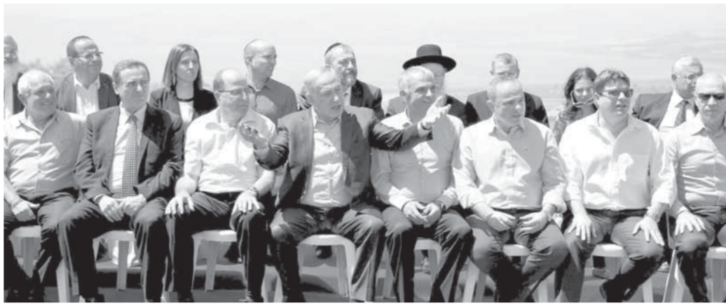
نتنياهوو خلال اجتماع الحكومة الأسبوعي في الجولان المحتل (رويتزر)

وأضافت الوزارة: تضع الجمهورية العربية السورية اليوم الأمم المتحدة أمام التزاماتها وواجباتها المنتمية في تنفيذ القرارات الصادرة عن الجمعية العامة وعن مجلس الأمن وهي القرارات التي لم تعترف بالاحتلال الإسرائيلي للأراضي السورية ولا سيما قرار مجلس الأمن الدولي رقم ٤٩٧ لعام ١٩٨١ الرافض لقرار الكنيست الإسرائيلي السمي بالصيت بضم الجولان السوري الذي لم تعترف به دولة واحدة من دول العالم لتعارض ذلك مع القانون الدولي والقانون الدولي الإنساني وحقوق الإنسان وإذا كان قرار الأمم المتحدة رقم