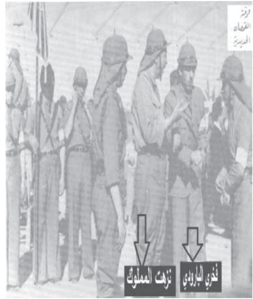
تدريب الشباب الوطني على السلاح للدفاع عن مصر وطرد الاستعمار من البقاع العربية، هنا وجدت الدولة السورية أنه لا بد لها من تنفيذ رغبات الشعب ليكون له شرف الدفاع عن أرض الوطن العربي، وأخذت القيادة العامة للجيش والقوات المسلحة على عاتقها مسؤولية تدريب أبناء الشعب، وبتاريخ ١٤-٨-١٩٥٦م أصدرت القيادة العامة للجيش والقوات المسلحة أمراً بتشكيل قيادة خاصة مرتبطة بها تحت اسم القيادة العامة للمقاومة الشعبية.

المادة ٣: «الشباب الوطني» هيئة تهيئية، تعمل على نشر مبادئ الأخلاق الإنسانية والوطنية، ورفع مستوى الحياة الاجتماعية والثقافية والاقتصادية.