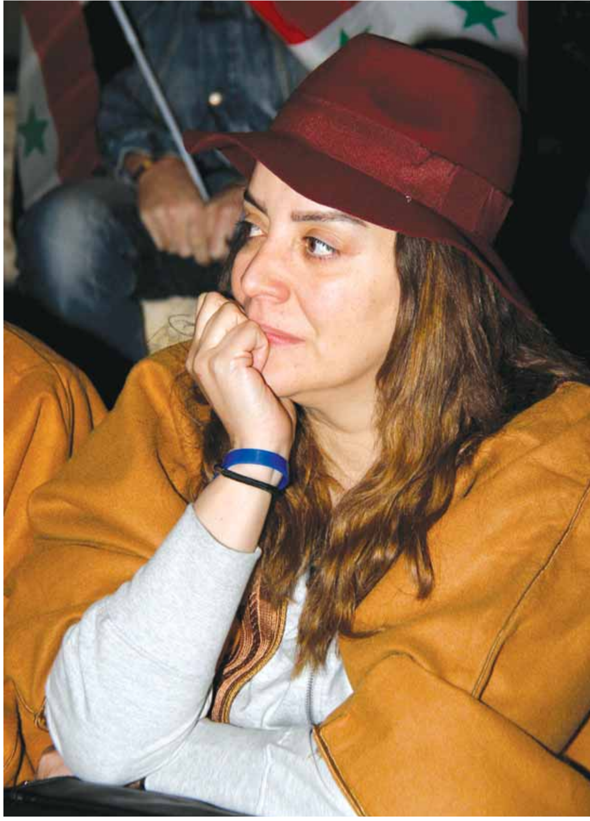
النجمة السورية شكران مرتجى خلال حضورها فعالية «بوابة الشمس» في مدينة تدمر.