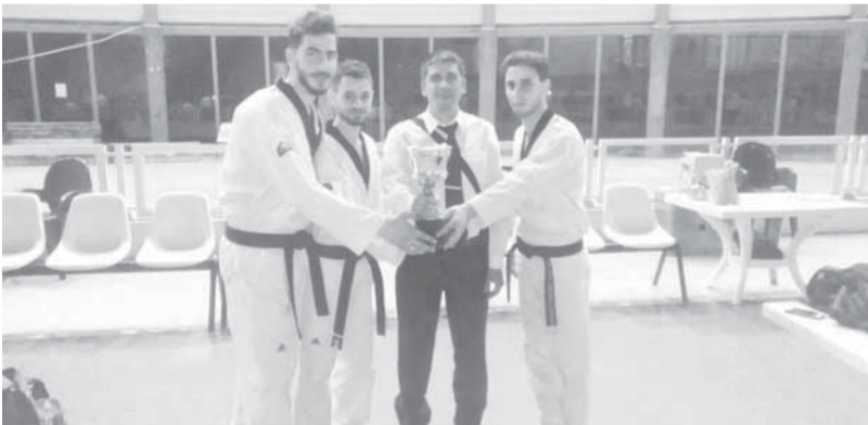
أبطال فريق بردى

والقوة البدنية والمصارعين الرومانية والحررة والتايكواندو والتريپلثون وتعمل على توسيع قاعدة لعبة الليباردو والسوكو، وقواعدنا بكرة السلة ممتازة، وتعمل على دفع سيدات النادي نحو الأمام تطوراً وتقدماً ولدينا مشروعات إنشائية الأول تجديد صالة الليباردو والسوكو وإجراء بعض التعديلات لتصبح بمواصفات عالمية مع تأمين كل المستلزمات، ونحن في الخطوات الأخيرة من هذا العمل الإنشائي المهم، والمشروع الثاني بناء هتكار للسلة، يتم إجراء التدريبات فيه، وإقامة المباريات وهو مشروع حيوي وضروري لسلة النادي، وستتم المباشرة به قريباً وسيتم على مراحل لأن كلفته التقديرية كبيرة.