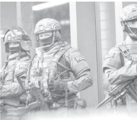
عناصر من منظمة الشرطة الجنائية الأوروبية «اليوروبول»

بيد أنها أعلن قائد قوات الشرطة الاتحادية العراقية، الفريق راشد شاكر جودت، أمس عن