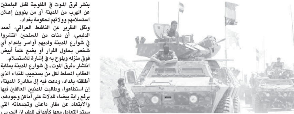
قوات عراقية تتقدم نحو الفلوجة