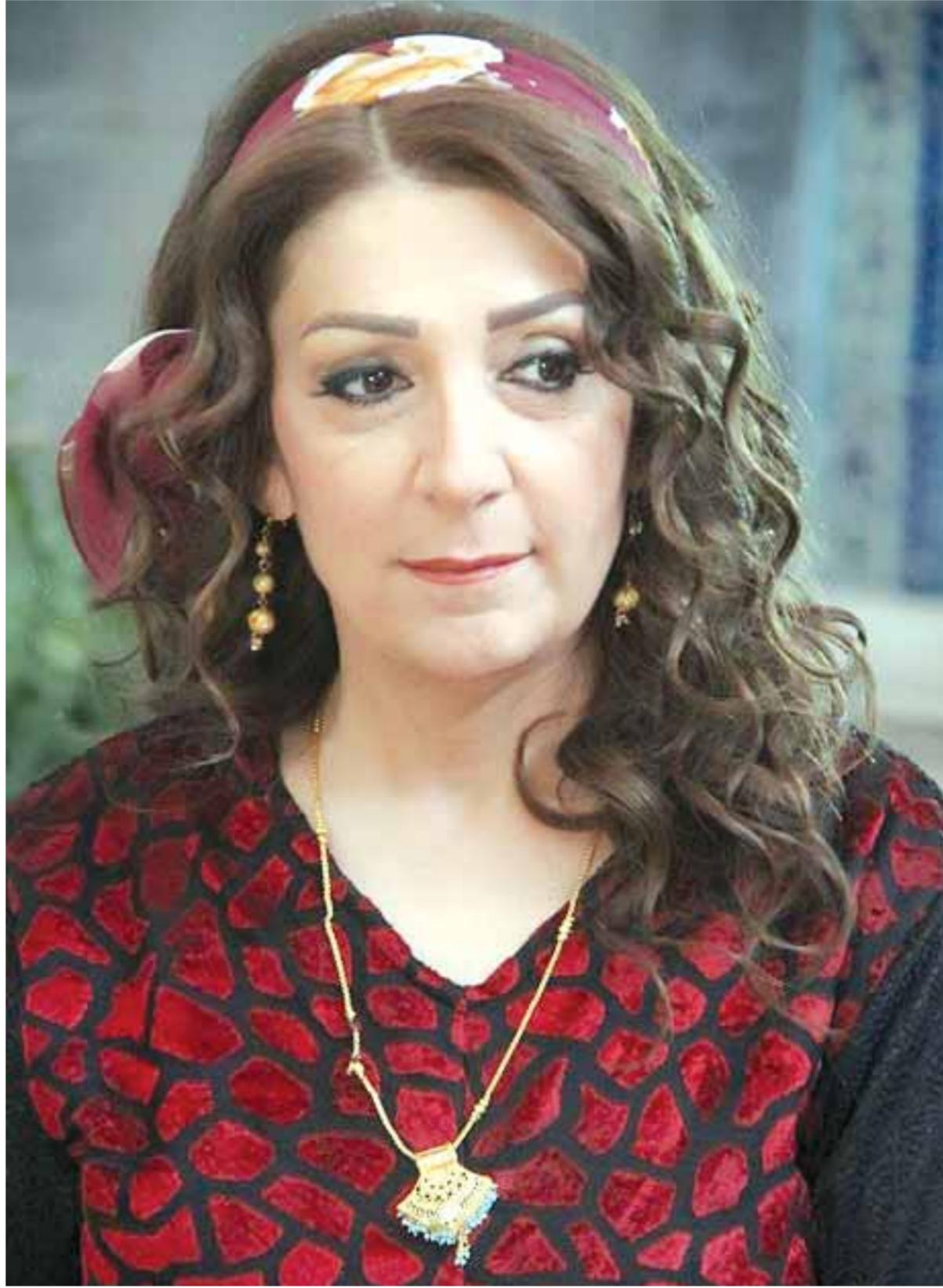
النجمة السورية وفاء موصلي في الجزء الثامن من مسلسل «باب الحارة»، وهي من الفنانات اللواتي لم يغبن عن العمل الشامامي منذ جزئه الأول.