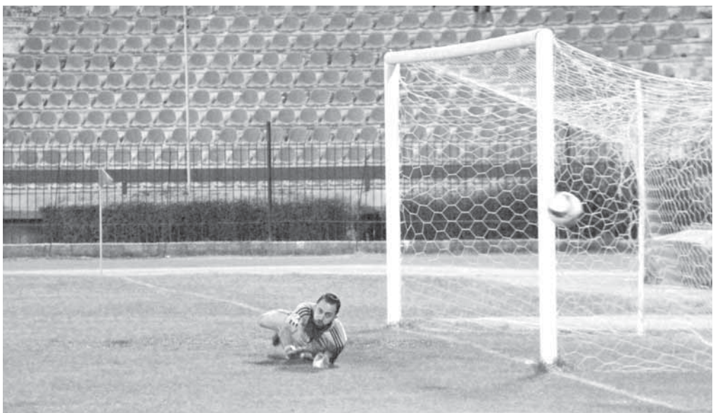
من مباراة الجيش والاتحاد