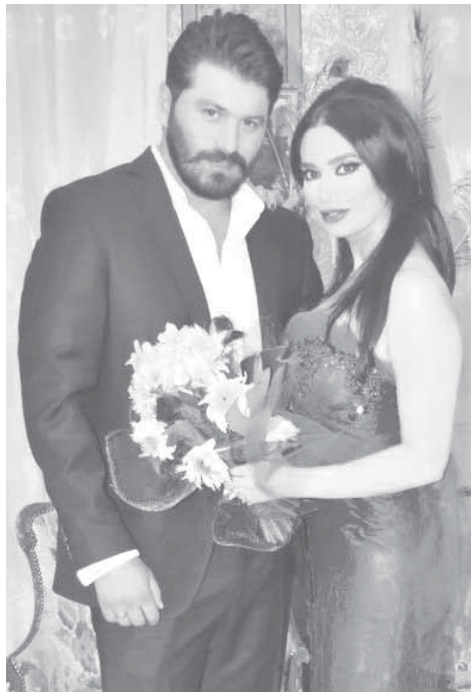
رنا الأبيض ووزن السيد

أحدث النجم المصري تامر حسني زوبعة إلكترونية عقب طرحه غلاف ألبومه الجديد «عمري ابتداء» عبر صفحاته