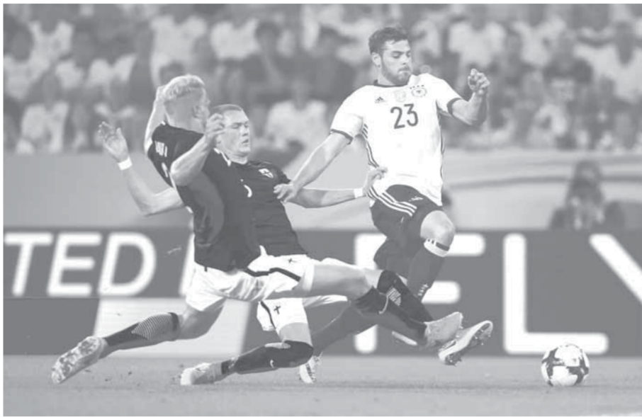
الألمان أبطال العالم فازوا على فنلندا في آخر استعداداتهم

لقب ١٩٩٨ ووصيف ٢٠٠٦ وهولندا وصيف البطل عامي ١٩٧٤ و١٩٧٨ والسويد التي تعودت حضور النهائيات في الألفية الجديدة ويلغاريا أحد المنتخبات المشاغبة. ويرشح المراقبون ديوك فرنسا لصدارة المجموعة خاصة بعد النتائج الكبيرة في بطولة أوروبا الأخيرة حيث حل وصيفاً للنظ وكذلك وجود كم هائل من اللاعبين المرزبين على الساحة الأوروبية تحت إمرة المدرب الطموح بدييه ديشان وعلى رأسهم أغلى لاعب في العالم بول بوجبا ومعه غريزيمان وغامبرو وغيرو وكنتي وسيسوكو وسواهم.