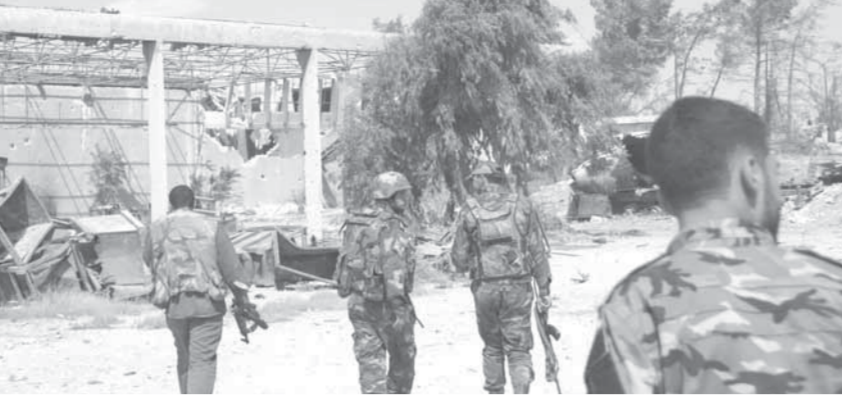
الجيش السوري يقوم بتأمين المناطق التي سيطر عليها في محيط الراموسة

وأضاف المصدر: إن الجيش استطاع إحراز تقدم جديد على محور مشروع ١٠٧٠ شقة سكنية ومدرسة الحكمة باتجاه تل بازو.