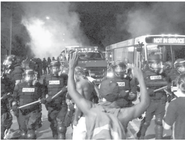
مواجهات مع قوات مكافحة الشغب في شارلوت بولاية كارولاينا الشمالية