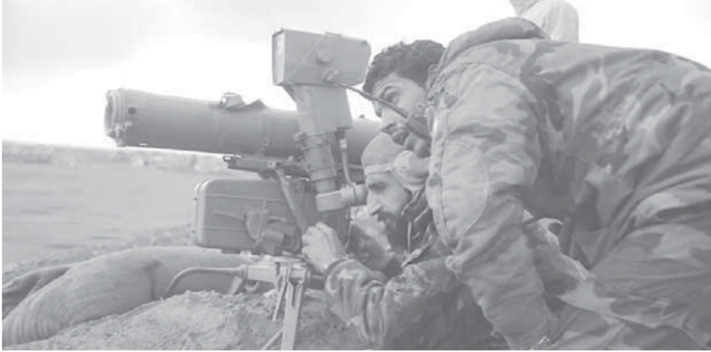
عصران من الجيش السوري يستهدفان تجمعات الإرهابيين في دير الزور