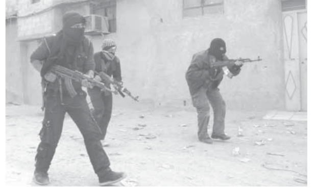
عناصر مسلحة في الهامة