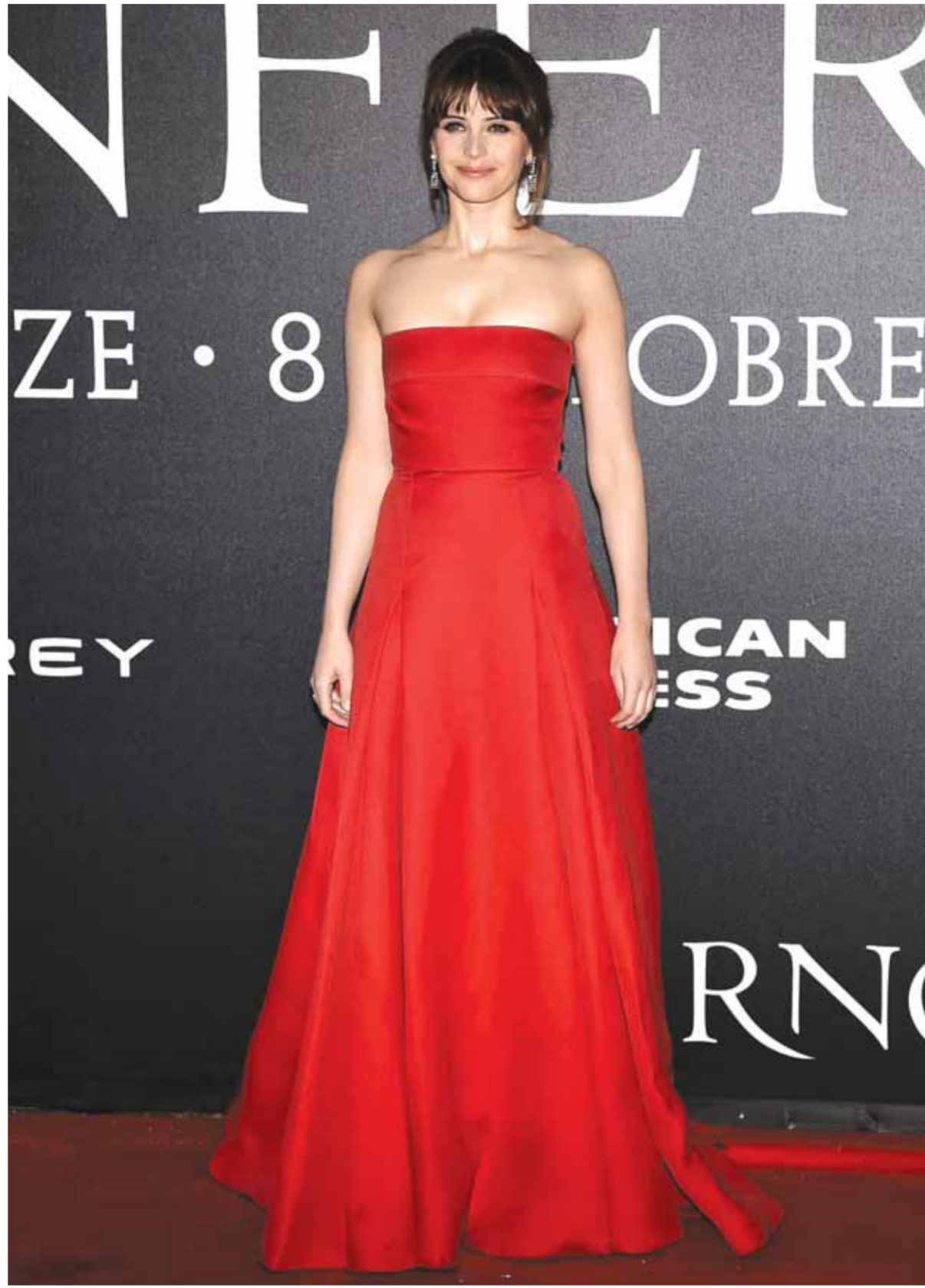
النجمة فيليستي جونز تتألق بفستان أحمر أنيق خلال العرض الأول لفيلم «Inferno» في فلورنسا بإيطاليا.