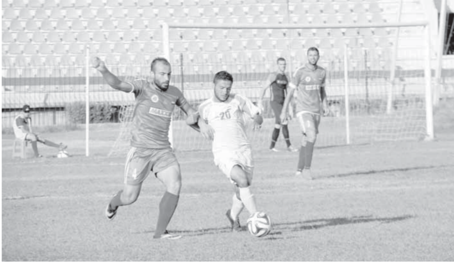
من مباراة حطين والمجد

الحرية فاز على مصفاة بانبايس ١/صفر وعلى الكسوة ١/٢ وخسر أمام فرق المقدمة المجد ٥/١ وأمام حطين صفر/١ وتعادل ثلاث مرات مع النواعير والجهاد ١/١ ومع جبله صفر/صفر، ويتعد عن الرابع بنقطة واحدة، وله أمل كبير بدخول الدوري الممتاز إن تحسن أداءه وتناجحه وخشي الفرق الذي تقع خلفه. الكسوة ضاعت أماله في شربة ماء عندما تعثرت نتائجه في خط النهاية فحسر نقاطاً مضاعفة مع فرق تباريه وتنافس على دخول الدوري الممتاز، فحسر أمام النواعير ٥/٣ وأمام الحرية ٢/١ وهما أشد تأثيراً من خسارته أمام جبله صفر/٢.