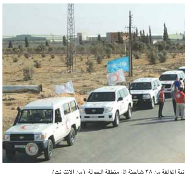
قافلة المساعدات الإنسانية المولفة من ٣٨ شاحنة إلى منطقة الحوثة

إطلاق عملية تأهيل البنى التحتية بداريا.. وإدخال مساعدات إلى الحوثة مصالحة الوعر بنهاياتها واليرموك قائمة ووادي بردى على الطريق وكالات