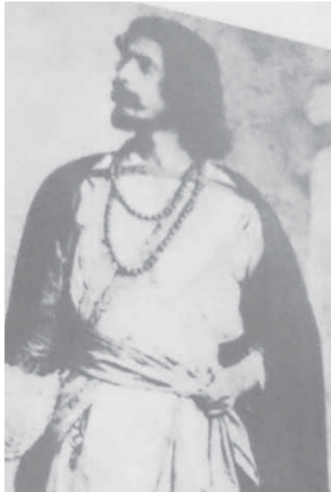
رابطها إن العربية